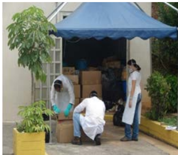
Figura 11. Gestión de Desechos Especiales del INHRR.