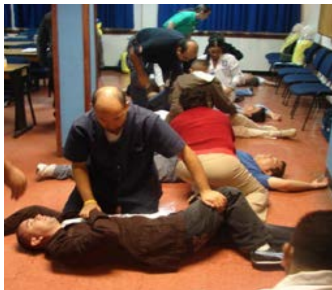
Figura 4. Formación de Primeros Auxilios Nivel I para el Personal del INHRR