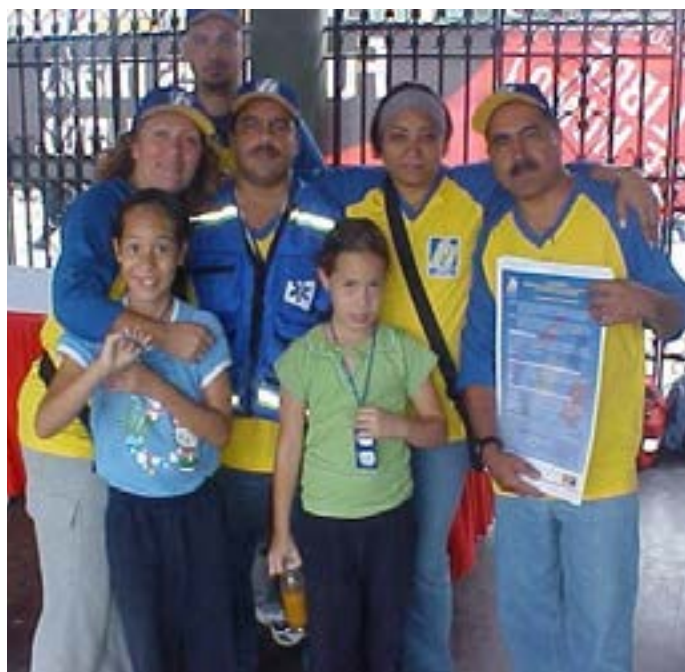
Figura 5. Participación de la Brigada Control de Emergencias del INHRR en eventos

La Gerencia de Seguridad Industrial, Ambiente e Higiene Ocupacional es una unidad asesora adscrita a la Presidencia del Instituto, cuya función principal es velar por la seguridad integral de las trabajadoras, trabajadores e instalaciones del Instituto, enfatizando en las acciones preventivas, promoviendo la cultura de seguridad y prevención en la Institución y asesorando a las diferentes unidades en materia de Seguridad Industrial; así