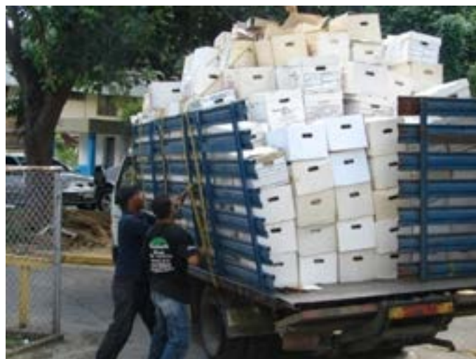
Figura 13. Programa de reciclaje de papel del INHRR.