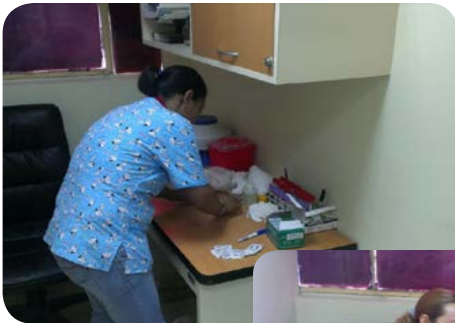
Figura 6. Coordinación del Operativo Médico laboral para el Personal de INHRR.