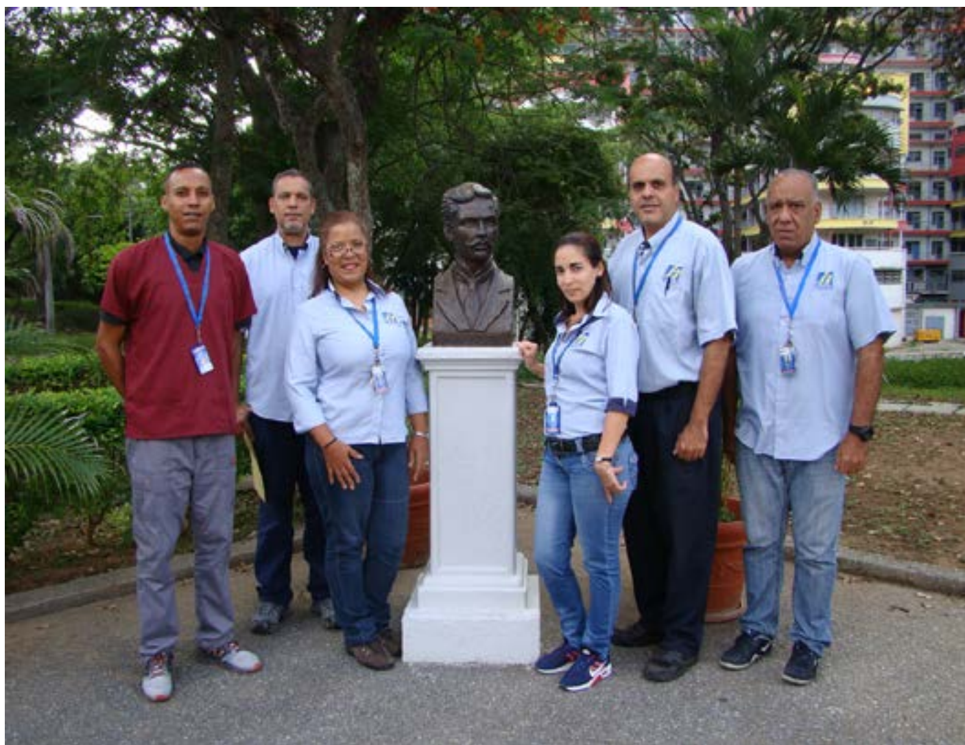
Figura 14. Personal adscrito a la Gerencia de Seguridad Industrial, Ambiente e Higiene Ocupacional.