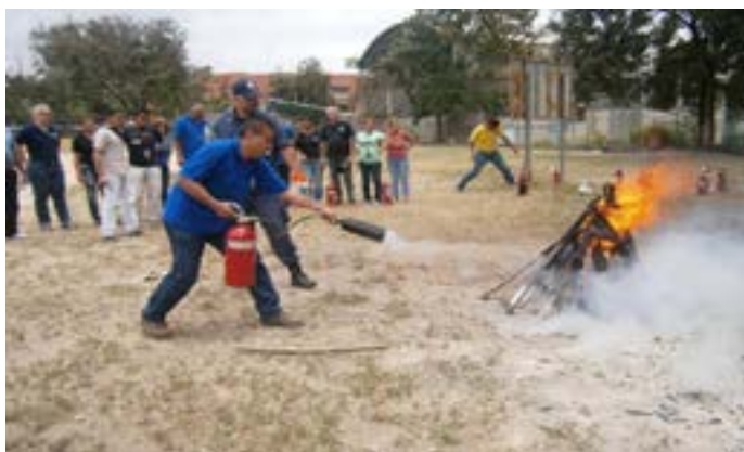
Figura 3. Formación de Manejo de extintores para Organismos del Estado.