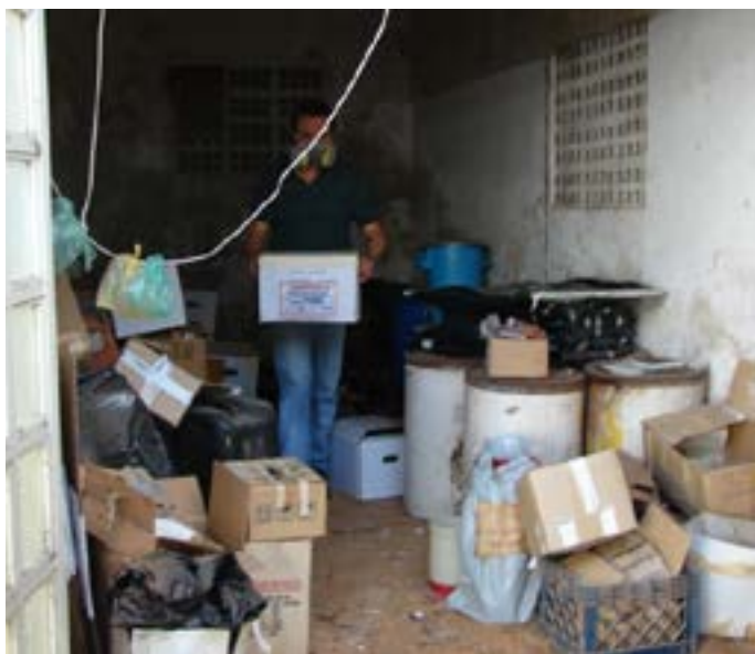
Figura 10. Gestión de Desechos Especiales del INHRR.