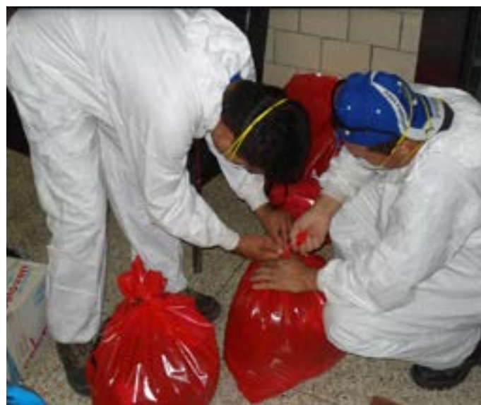
Figura 8. Gestión de Desechos de Origen Biológico en el INHRR.

Durante el periodo 2008 - 2009 se gestionó la disposición final de desechos especiales de origen químico y farmacéutico ( Figura 10 y 11 ).