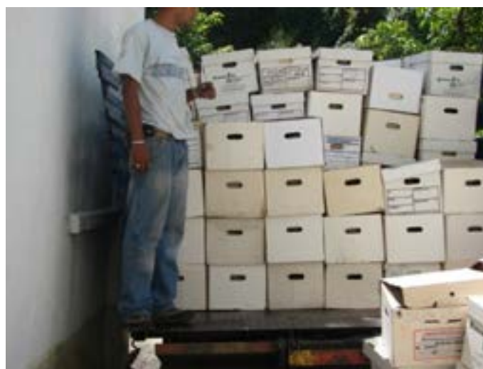
Figura 12. Programa de reciclaje de papel del INHRR.

- Consolidar el Proyecto de Sistema Integral de Alarma Contra Incendio del INHRR.