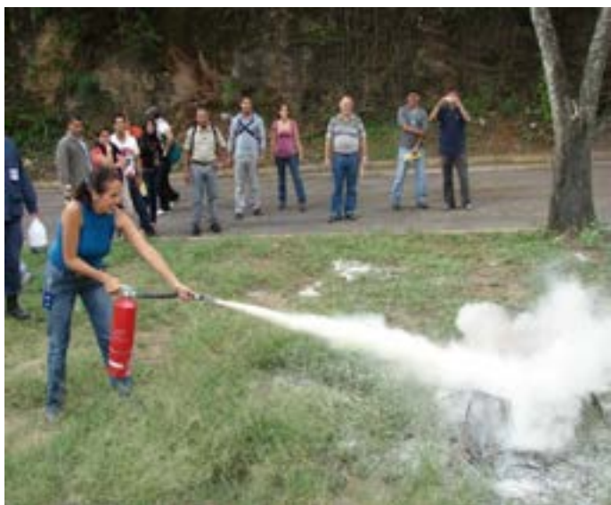
Figura 2. Formación de Manejo de extintores para el personal del INHRR.