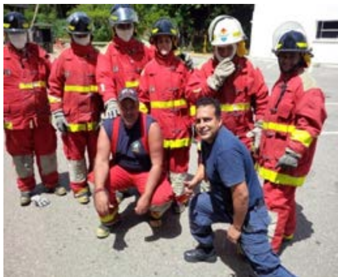
Figura 1. Formación y capacitación para Brigada Control de Emergencias del INHRR.