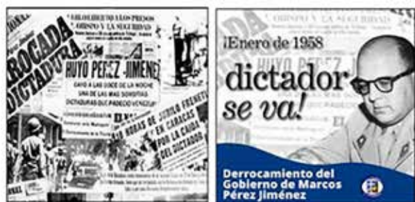
Figura 3. Caída del régimen dictatorial en Venezuela, 23 de enero de 1958.

partido AD y Enrique Aristeguieta Gramcko por el partido Copei. El agrietamiento del régimen dictatorial avanzó, agudizado por las series de acciones urbanas hasta terminar en el 23 de enero de 1958, con la salida apresurada de Pérez Jiménez apoyada por un grupo de militares. Fueron testigos de este hecho anunciado por todos los medios de comunicación, lo muchos caraqueños que vivían cerca del Aeropuerto La Carlota, quienes vieron cuando en la madrugada el avión del dictador, la vaca sagrada, salía hacia el exterior (Figura 3).