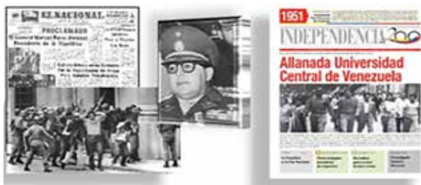
Figura 2. General Marcos Pérez Jiménez. Allanada la UCV en octubre de 1951. Flamerich destituyó los miembros del Consejo Universitario, los decanos de las facultades y los directores de las escuelas. Represión estudiantil.

La mayoría de los estudiantes suponían que posiblemente, había falsos estudiantes infiltrados en sus filas, miembros de la nefasta Seguridad Nacional, quienes asechaban los jóvenes revolucionarios de esa época. También, entre los estudiantes, corrían rumores fantásticos que aterraban algunos de ellos, como que, entre ellos, estaba “la hija natural del terrible Llovera Páez”, lugarteniente del dictador.