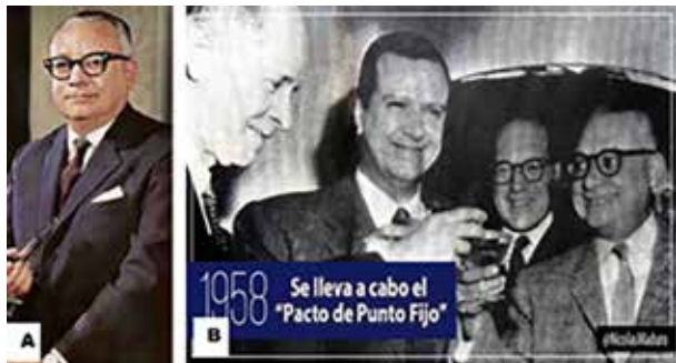
Figura 5. Pacto gubernamental entre AD, Rómulo Betancourt, COPEI, Dr. Caldera y URD, Dr. Jóvito Villaba.

Edgar Sanabria como presidente de la Junta de Gobierno, entregó el poder a Rómulo Betancourt, triunfador de las elecciones presidenciales convocadas para el 7 de diciembre de 1958. A Betancourt le esperaba una presidencia (1959-1964), nada más lejos de “un lecho de rosas” como escribió Arráiz Lucca: “la derecha atentaba contra su vida y la izquierda le declaraba la guerra a muerte, inspirada por la gesta castrista”. Afortunadamente, el gobierno de Betancourt se caracterizó por haber sobrevivido a los intentos de derrocarlo y por la estructuración del Gabinete Ejecutivo que se hizo de acuerdo con los grupos del Pacto de Punto-Fijo, condición que le dio fuerza y unión política (13) (Figura 5).