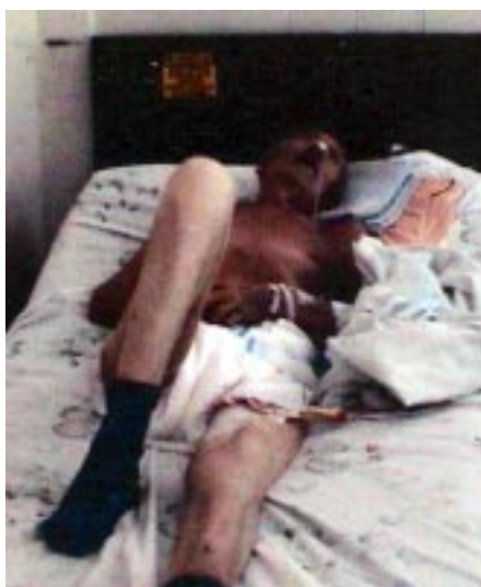
Figura 2. Puede apreciarse que el paciente puede mover fácilmente el miembro inferior derecho.

Resonancia magnética nuclear: Evento vascular isquémico, en fase subaguda precoz, comprometiendo lóbulos parietal posterior izquierdo y temporal homolateral. En la región temporal derecha acentuada área de encéfalo malasia por área de isquemia. Aumento de tamaño de ventrículos laterales por atrofia de sustancia blanca (Figura 5).