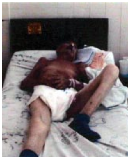
Figura 3. Puede observarse que el paciente puede mover fácilmente el miembro inferior izquierdo.

El paciente empeoró progresivamente, falleciendo 72 horas después de su ingreso en la Sala “B” del Servicio de Medicina Interna del Hospital Central de Valencia.