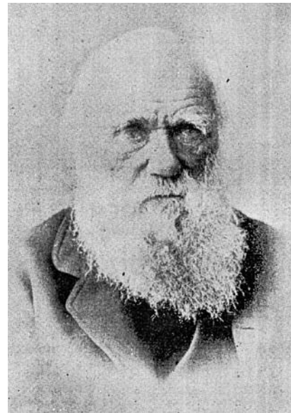
Figura 1. Carlos Darwin.

En el mismo número se incluye el informe del doctor Luis Razetti sobre la celebración del centenario de Darwin , en la Academia, el 12 de febrero de 1909 (Figura 1). Según el relator “El acto revistió gran pompa y solemnidad”. El gobierno estuvo representado por el ministro de instrucción pública, quien leyó un discurso sobre Darwin y su obra científica. Del cuerpo diplomático asistieron los