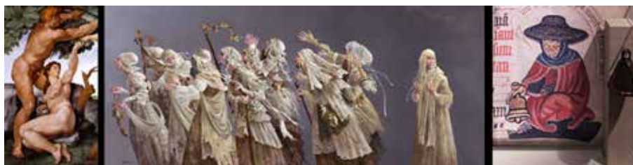
Figura 1. La lepra, trasunto del pecado original y maldición bíblica.

En el polo opuesto de la enfermedad mental, pero ligada a ella, durante los siglos XVIII y XIX, los enfermos del Mal de San Lázaro eran segregados y confinados a instituciones denigrantes llamadas lazaretos, leprosarios o leproserías. A imagen de Pinel, Jacinto Convit, nacido en Caracas en 1913 y graduado de doctor en ciencias médicas en 1937,