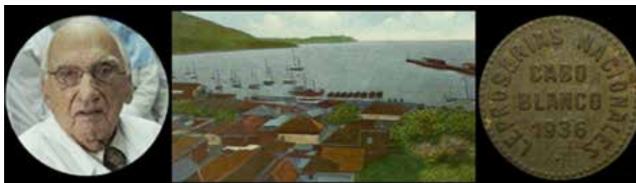
Figura 2. Maestro Jacinto Convit, el Pinel de los leprosnarios; leprosería de Cabo Blanco y ficha o moneda empleada para transacciones comerciales dentro del nosocomio.

Se elaboraron comprimidos y se realizó un estudio en 500 enfermos. Pronto se vio su efectividad, se notó mejoría clínica en ellos y se obtuvo control de la enfermedad y al favor de su ímpetu investigador,