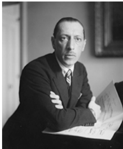
Figura 1. Igor Stravinsky.

estudios de Derecho y tiempo después cambió por la composición. En 1902, a los 20 años de edad, se convirtió en alumno de Nikolái Rimsky-Kórsakov, gran maestro y probablemente el compositor ruso más importante de su tiempo (4-6) (Figura 1).