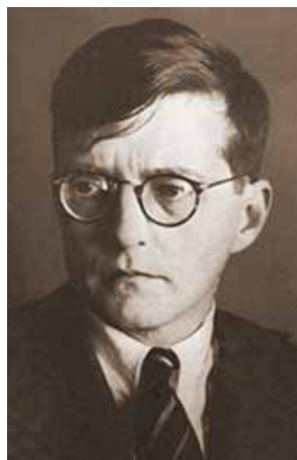
Figura 5. Dmitri D. Shostakovich.

De genio precoz, ingresó al conservatorio de San Petersburgo en 1922. Fue alumno de Alexander