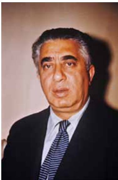
Figura 3. Aaram Katchaturian.

escribió su Poema Sinfónico (Tercera Sinfonía), al mismo tiempo que el secretario del comité central del partido comunista promulgó un decreto en el que condenaba a Khachaturian, Shostakovich, Prokofiev y otros artistas como “formalistas” y “antipopulares” (Figura 4); a pesar de que poco antes, estos tres habían sido denominados “ los titanes de la música soviética ”. Fue acusado en 1948 por el comité central del partido comunista por sus tendencias burguesas y antirrevolucionarias que ellos así interpretaron en sus composiciones musicales. Pero poco después ganó nuevamente el afecto del partido, y de hecho, recibió numerosos premios, como Premio Stalin, Premio Lenin, Premio URSS, Héroe del Trabajo Socialista. Este último era el máximo trofeo para la cultura y la economía del país. Volvió a su cargo de secretario de la Unión de Compositores Soviéticos en 1957, y además fue diputado del Supremo Soviet de la Unión Soviética desde 1958 a 1962.