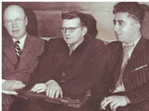
Figura 4. Prokofiev, Shostakovich y Katchaturian.

Compuso conciertos para violín, cello y piano y tres sinfonías. Sus obras más conocidas son los ballets Espartaco y Gayane. De este último forma parte su música más famosa: La Danza del Sable. Sus obras incluyen música para niños y música para películas, piezas de teatro y la llamada “Música incidental” (música de fondo para películas –banda sonora). Compuso más de cuarenta obras para cine y teatro.