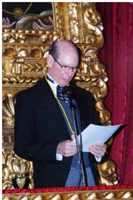
Figura 3. El recipiendario al momento de presentar su Discurso de Recepción a la Academia Nacional de Medicina.

El Académico Dr. Rafael Muci-Mendoza, se permitió pronunciar el Discurso de Bienvenida. El Presidente se permitió felicitar a ambos Oradores por tan excelentes disertaciones y habiéndose cumplido con el Orden del día el Presidente declaró clausurada la Sesión y en nombre del Dr. Saúl Kizer Yorniski, señora e hijos invitó a los presentes a un brindis en el Patio Cajigal (Figura 5).