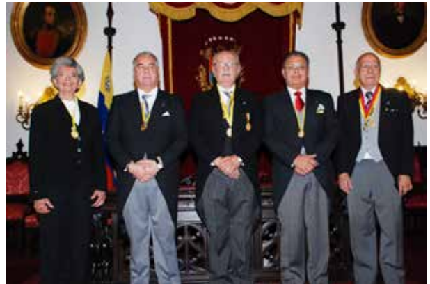
Figura 12. La nueva Junta Directiva para el Bienio 2018-2020.