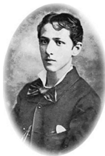
Figura 3. Luis Razetti antes de la universidad.