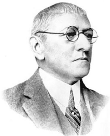
Figura 6. El Dr. Luis Razetti en la plenitud de su producción intelectual.

un impacto continental indiscutible, lo que le llevó a ser prácticamente copiado como propio en Colombia y Perú.