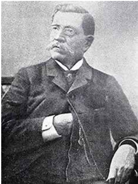
Figura 4. Profesor Adolf Ernst (1832-1899).

Rafael Villavicencio (Figura 5) fue miembro de lo que se ha considerado como la primera generación de hombres de la ciencia que preconizaron el llamado pensamiento positivista en Venezuela porque introdujo la filosofía positivista y el positivismo biológico en la Universidad Central de Venezuela y su obra es clave para entender la proyección y el desarrollo