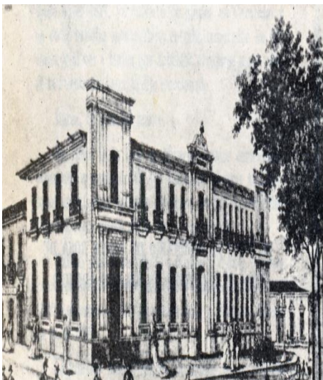
Figura 7: Sede de La Real y Pontificia Universidad de Caracas, Actual Palacio Arzobispal.

La Universidad y el seminario permanecieron funcionando conjuntamente en el mismo edificio, con las mismas autoridades e iguales cátedras y un mismo rector. En 1784 el rey Carlos III dispuso la separación del rectorado de la Universidad del Colegio Seminario Tridentino. Asimismo, en 1784 el Claustro Pleno alcanzó la facultad de elegir al Rector de la Universidad, por Real Cédula de