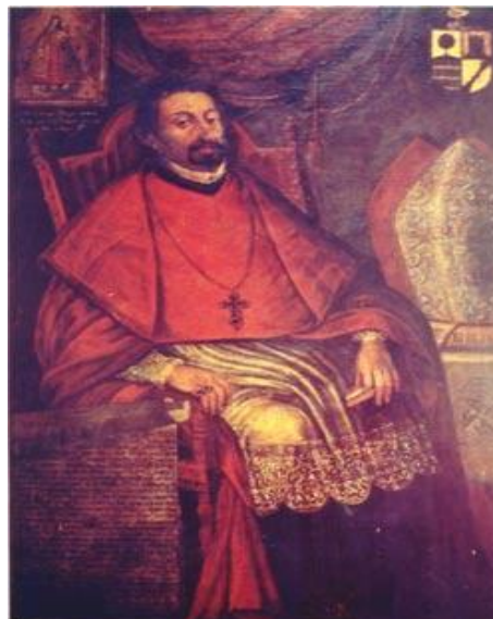
Figura 2: Don Diego Baños y Sotomayor

En 1684 asume la silla episcopal en nuevo obispo de Caracas, Don Diego de Baños y Sotomayor, quien también era Limeño y doctor en Teología de la Universidad de Santa Fe de Bogotá. El Obispo prosiguió la construcción hasta que quedo concluida y el 29 de agosto de 1696 se inaugura solemnemente el colegio seminario Santa Rosa de Lima. Desde ese mismo año el Obispo Baños y Sotomayor había solicitado a la Corte se aprobase la facultad para que el Colegio pudiese otorgar Grados a sus estudiantes, para evitar los gastos y peligros de trasladarse a Bogotá, Santo Domingo o México para obtenerlos. Aquellos estudiantes que deseaban obtener grados universitarios, tenían que hacer grandes sacrificios económicos para poder costearse un largo y riesgoso viaje a las universidades de Santa Fe, México o Santo Domingo. Se aventuraban a cruzar peligrosos caminos o mares infectados de piratas, muchos de estos estudiantes perdieron la vida