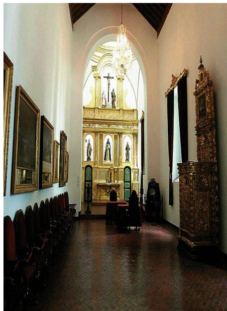
Figura 5: Capilla Santa Rosa de Lima