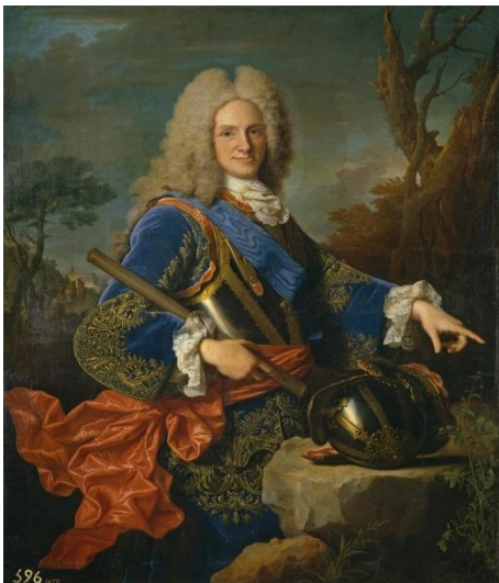
Figura 4: Rey Felipe V de España Fuente: museodelprado.es [Internet]. Disponible en: https://www.museodelprado.es/coleccion/obra-de-arte/felipe-v-rey-de-espaa/2e64f6c5-a241-4de9-bb50-3585f557ded1

El 18 de diciembre de 1722 para darle validez en el mundo cristiano a los títulos emitidos por la Real Universidad de Caracas, el Papa Inocencio XIII le otorga la condición de Pontificia, mediante una Bula Apostólica. Se materializaba así la doble erección de la Universidad de Caracas, tanto por el poder temporal del Rey Felipe V como por el poder espiritual del Papa Inocencio XIII, con lo que se lograba culminar un proceso de 130 años de trámites e interrupciones. La provincia de Venezuela ya contaba con una universidad.