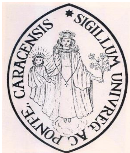
Figura 6: Sello de la Real y Pontificia Universidad de Caracas.

El 8 de mayo de 1727 en la ciudad de Aranjuez, el rey emite la real cedula de constituciones de la