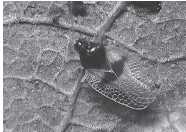
Figura 1. Adulto de P. perseae , sobre hojas de aguacatero.

Todos los ejemplares fueron colectados en follaje de aguacatero; Venezuela, Estado Aragua, El Paseo, “La Ponderosa”, 06.ix.2002, 03.x.2002, 19.x.2002, 22.i.2003, 20.ii.2003, MF Sandoval Cabrera.- Campo Experimental Central CENIAP-INIA, 20.v.2003, 24.x.2003, MF Sandoval, F Godoy, J Perozo. Avenida principal de Caña de Azúcar, Sector 09, Maracay, 14.x.2004, MF Sandoval