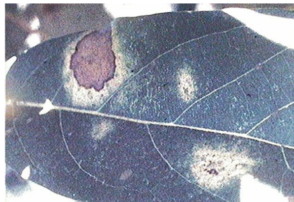
Figura 3. Hoja adulta de aguacatero con diferentes grados de daño causado por colonias de P. perseae .