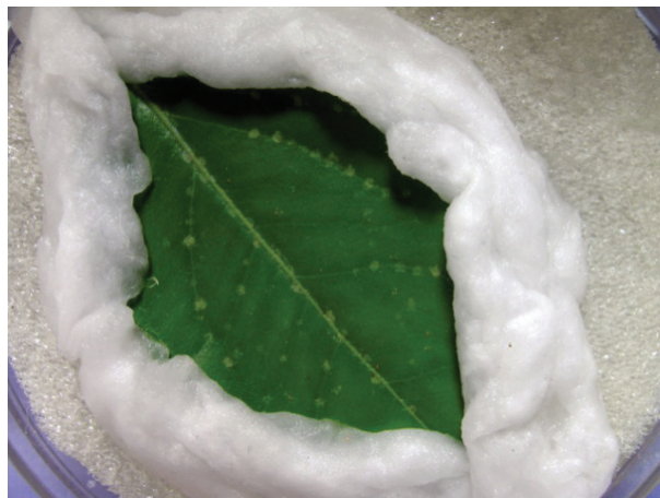
Figura 1. Arenas de cría, utilizadas en condiciones de laboratorio.

Este estudio se llevó a cabo en condiciones de laboratorio de 25 \pm 2 °C y 83 \pm 12\% de humedad relativa. Se usaron como sustratos de alimentación, hojas de naranja ( Citrus sinensis ), lima persa ( Citrus latifolia ) y limón criollo ( Citrus limon ). Estas hojas fueron colocadas con la haz hacia arriba en cápsulas de petri plásticas formado 35 arenas, divididas en dos secciones, totalizando 70 secciones por tratamiento, como se muestra en la Figura 1. Se humedecían diariamente para mantener la