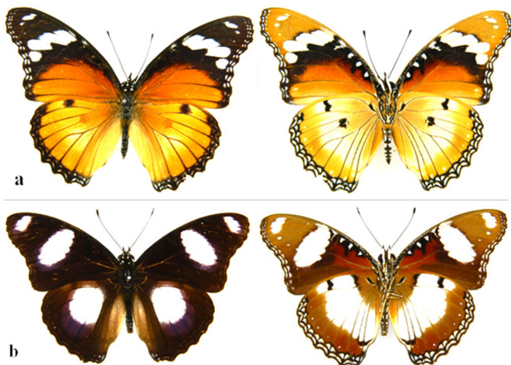
Figura 1. Hypolimnas misippus . a: Hembra, vista dorsal y ventral; b: Macho, vista dorsal y ventral.