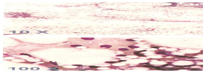
Figura 2. Aspirado de Médula ósea. Corte teñido de hematoxilina-eosina, con aumento de 10X y 100X. Obsérvese la gran hipocelularidad y el infiltrado grasa

El aspirado de médula ósea revelaba médula ósea con panhipoplasia celular en relación probable con hipoplasia medular, y la biopsia evidenciaba médula ósea con hipoplasia moderada para la edad y celularidad de 30%, con hematopoyesis trilineal con maduración adecuada, con infiltración grasa, sin evidencia de infiltración por leucemia o linfoma.