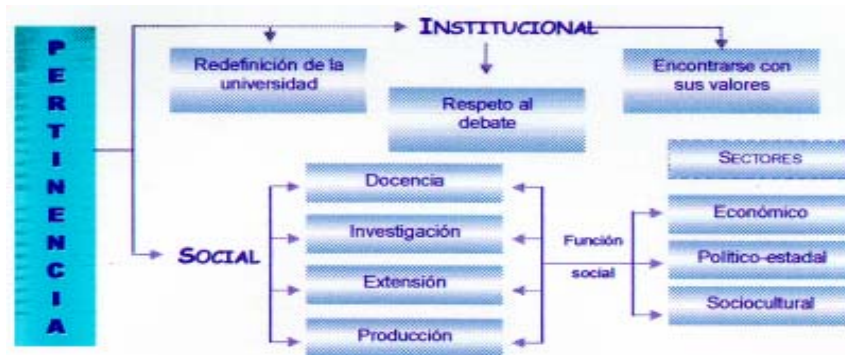
Figura N° 1 Tipos de Pertinencia