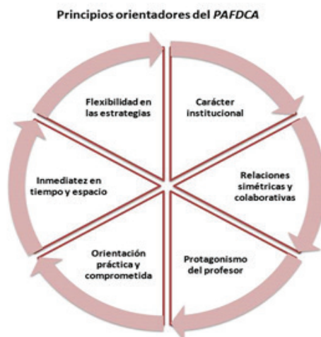
Figura N° 1.