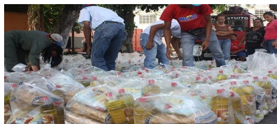
El régimen de gobierno ha creado un mecanismo de control social a través de la distribución de alimentos a por los Comité de Alimentación CLAP.

Comer “Mickey” - en clara alusión al popular ratón mascota de Disney - se ha vuelto un trabajo a tiempo completo para los dos jóvenes. Una labor que realizan en conjunto con sus familiares: los padres lavan, pelan y preparan los roedores. Las trampas las arman entre los adultos y los niños y luego las “siembran” - las colocan - en las zonas que consideran más “efectivas”. La cacería le ha proporcionado a las dos familias un acceso a una fuente de proteínas que les está salvando la vida.