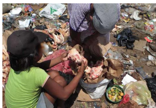
Una pequeña niña rebusca alimentos entre la basura.

temor “puro, duro y sincero. No voy a subir cerro a la noche” dice en referencia a llevarlos hasta su casa en La Maca. Y los chicos porque la competencia por atrapar las ratas está arreciando: “mejor llegar tempranito, sembrar las trampas como es debido y garantizarnos la papa - el alimento - loquito, porque ahora cada vez hay más trampas y menos Mickeys”.