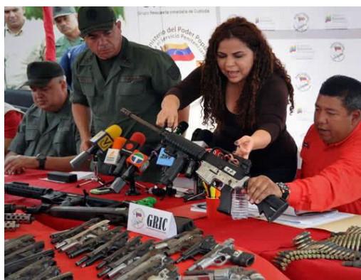
La Ministra para Asuntos Penitenciarios Iris Varela en una supuesta incautación de armas en un penal venezolano.

solamente durante el pasado 2017 El Nacional Web, 2017 a ). El chico teme, con razones justificadas, que la competencia por comerse las ratas sea tan feroz, que termine en enfrentamientos a tiros. Una situación para nada descabellada, considerando que en Venezuela existe una impunidad de 92% en los delitos de asesinato (La Razón, 2016) y que es más fácil y casi más barato comprar un revolver calibre .38 que un kilo de arroz (Mayorca, 2016).