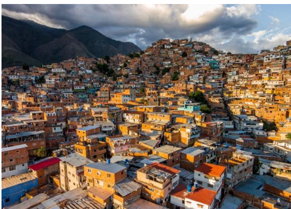
Barrio "Petare", Municipio Sucre, Edo. Miranda, el más grande de Latinoamérica.

total de Petare en 1998 en poco más de 80.000 habitantes (Petare, s/f). En ese año Hugo Chávez ascendió a la presidencia con un proyecto claramente comunista y la firme promesa de acabar con la miseria y la pobreza, pero falló miserablemente. Un censo reciente coloca la macro favela de Petare en más de medio millón de almas, y cifras extraoficiales expanden los números hasta unos impresionantes 1,6 millones de habitantes.