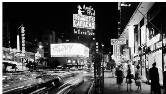
Caracas para 1967.

¡Na' chamo! ¿Y yo soy el loco? ¿Mejor que Brasil y Colombia y Puerto Rico? Nah Loquito... que va... tas cobeando loquito. Aquí siempre se ha estado igual