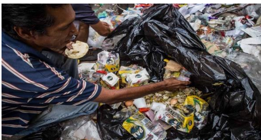
La pobreza extrema que azota a las familias venezolanas ha impulsado a muchas personas a hurgar en las bolsas de basura para poder comer.

El caso de Loquito es más o menos similar: