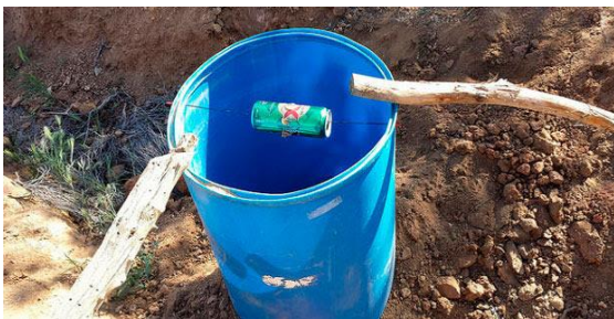
Imagen referencial de una trampa para cazar ratas.