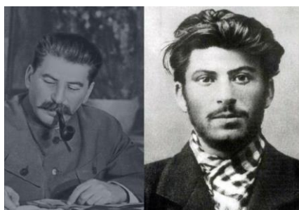
Iósif Stalin, secretario general del Comité Central del Partido Comunista y líder de la Unión Soviética, ejecutor de uno de los más grandes genocidios en la historia de la humanidad.

Algo similar ha ocurrido con las generaciones posteriores al régimen soviético, luego de casi tres décadas de su colapso definitivo. No sólo por padecer una sociedad sin libertades, de escasez crónica y severas restricciones cotidianas, sino además por el terror a la eficiente maquinaria represiva de aquel régimen totalitario, de cuyo seno surgió el lacónico personaje que preside su actual régimen despótico. Sin duda, la juventud postsoviética optó por el derecho al olvido. Tanto, que ha facilitado consolidarse, casi sin oposición, al nuevo régimen nacionalista totalitario de Vladimir Putin.