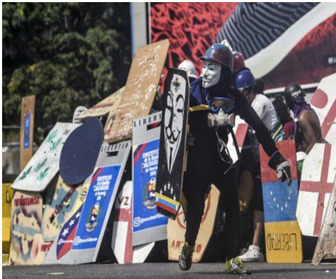
Escuderos de la Resistencia venezolana haciendo frente a la represión de la Guardia Nacional Bolivariana en la autopista Francisco Fajardo.

Además, pocos niegan la opción de negociar, sólo que ésta debe hacerse de la manera más transparente posible y sin menoscabo de los más esenciales derechos. Lograr la más mínima concesión del régimen en el restablecimiento del orden constitucional y democrático implicaría su pronta salida del poder. Esto lo sabe muy bien el régimen y por ello se