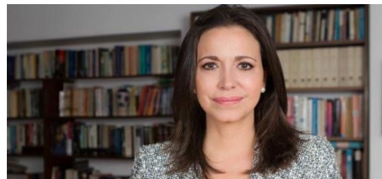
María Corina Machado, líder del partido político “Vente Venezuela”.

Igualmente, María Corina Machado, en entrevista realizada por Panampost (2017, julio 20), afirma que la sociedad civil venezolana no lleva más de cien días protestando las calles con el objetivo de evitar el proceso constituyente impuesto del régimen. La gran mayoría de los venezolanos exige un cambio de gobierno. Y afirma que “No vamos a tolerar que transición se convierta en transacción”.