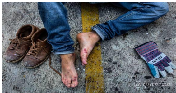
Pies descalzos de un manifestante de la Resistencia venezolana, luego de una larga jornada de intercambio con la Guardia Nacional Bolivariana.

Definitivamente, en el escenario de la calle la gente comienza a asumir más protagonismo y compromiso, haciéndose con el derecho de proponer, organizarse y manifestar no sólo contra el régimen, también para expresar su desacuerdo con las decisiones de la MUD, o con la ausencia de decisiones.