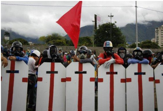
Escuderos de la Resistencia venezolana en la autopista Francisco Fajardo de Caracas.

política y la representación que les responsabilizan.