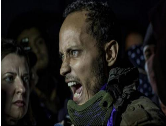
Óscar Pérez, piloto de helicóptero que atacó sedes gubernamentales, haciendo presencia en marcha de la Resistencia en el Distribuidor Altamira el 14 de julio de 2017.