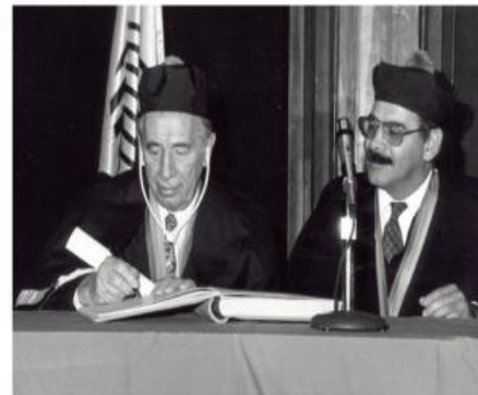
Shimón Peres en la Universidad Simón Bolívar (USB) recibiendo el título Doctor Honoris Causa.

algunos cargos gubernamentales de los tantos que muy efectivamente ejerció Peres, uno de los grandes políticos del siglo XX, capaz de dirigir la fundación de un estado con mucha asertividad y mano dura, pero a la vez con mucho sentido de respeto a los derechos humanos.