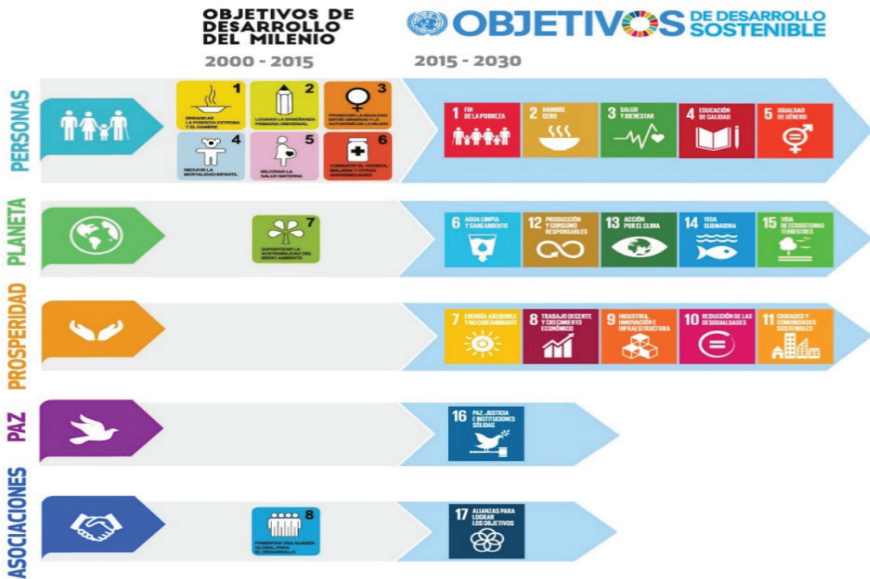
Figura 5 De los ODM a los ODS

A diferencia de los Objetivos de Desarrollo del Milenio (ODM), que básicamente abordaron problemáticas propias del ámbito social, los ODS refuerzan otras dos dimensiones del desarrollo: la económica y la ambiental (figura 5).