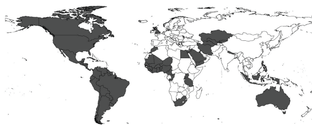
Figura 1. Fortificación obligatoria de la harina de trigo (8).

Hoy en día, hay 81 países que requieren la fortificación de harina de trigo (Figura 1)(8). América Latina y el Caribe es la región donde la mayoría de los países poseen fortificación obligatoria de harina de trigo. Existen 12 países que requieren la fortificación de harina de maíz: 6 países ubicados en América y 6 países en África (Figura 2)(8). De los 81 países que tienen legislación obligatoria de la fortificación de harina de trigo o harina