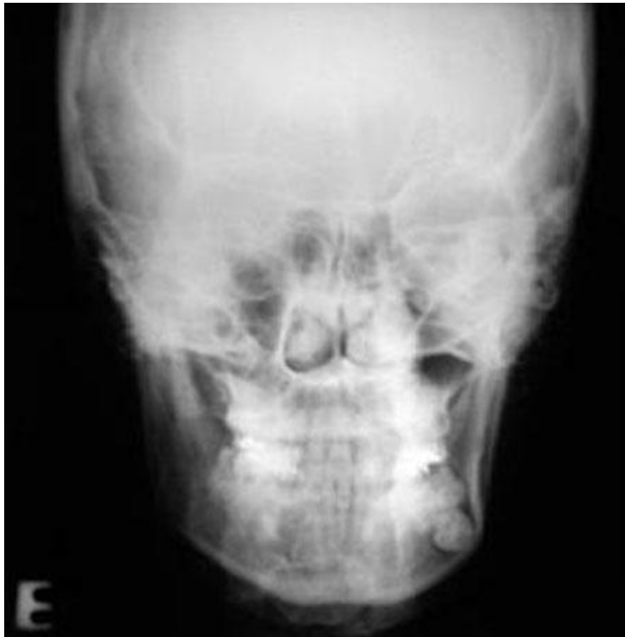
Figura 3 Radiografía postero-anterior de la mandíbula. En el diente 3.8, fue observada la presencia de un área radiolúcida en la corona dentaria asintomática, sugiriendo una caries oculta.

Al examen físico intrabucal, se observó la presencia de una tumefacción dura a la palpación en la superficie lingual del lado derecho.