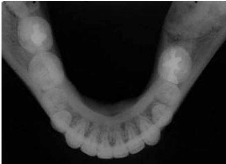
Figura 2 Radiografía oclusal total de la mandíbula. Presencia de ligero abultamiento en la cortical lingual del lado derecho.