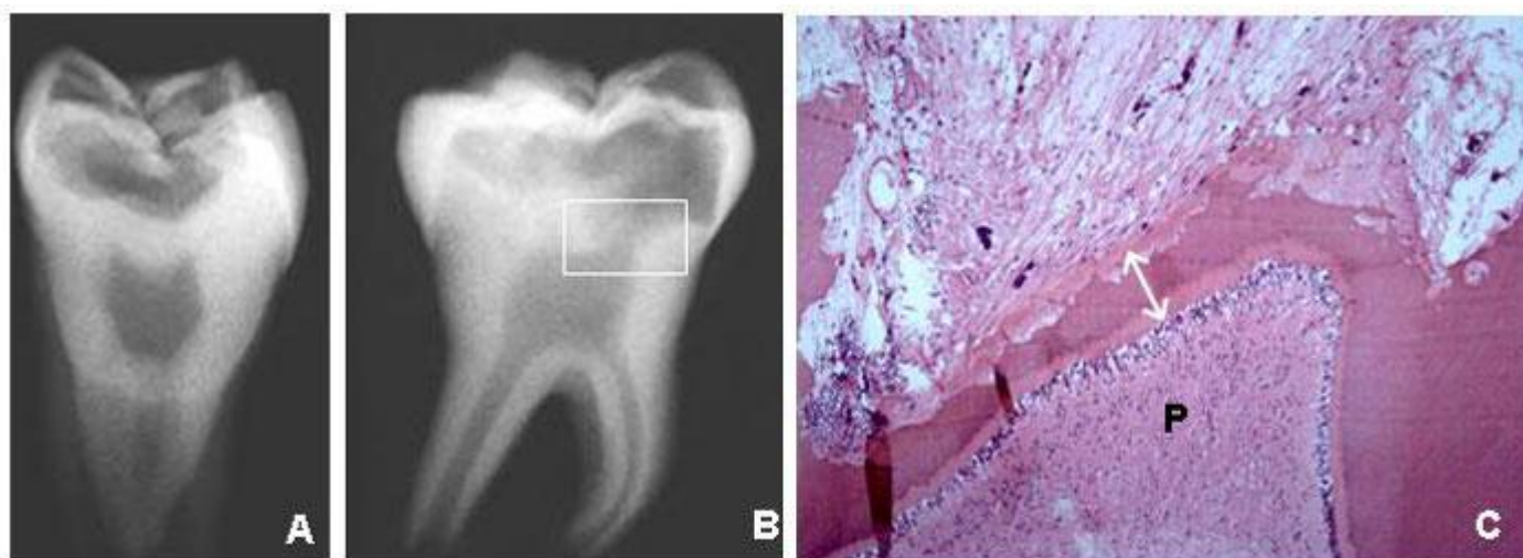
Figura 5 Aspectos radiográficos del diente aislado (A y B) y de la microscopia de la región más profunda y pulpar de la reabsorción dentaria externa (C) con preservación de la fina capa de dentina mineralizada y de la pré-dentina (fecha doble). Subyacente, la pulpa (P) preservó su organización estructural, especialmente en la capa odontoblástica, sin ningún infiltrado inflamatorio. Las lagunas de Howship son numerosas y no presentan clastos pues probablemente la reabsorción se encuentra inactiva en los cortes examinados.