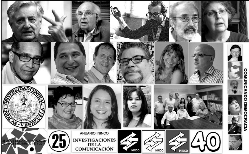
Fotocomposición de Carlos Guzmán Cárdenas. ©®ININCO Junio 2013