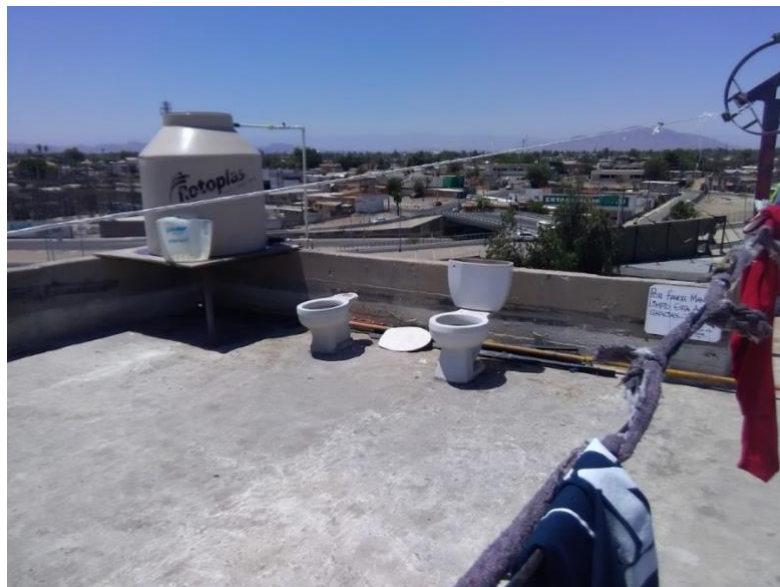
Figura 3. Sanitarios en la azotea del Hotel del Migrante