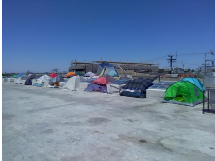
Figura 2. Azotea del Hotel del Migrante