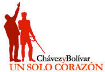
Imagen nro. 2.