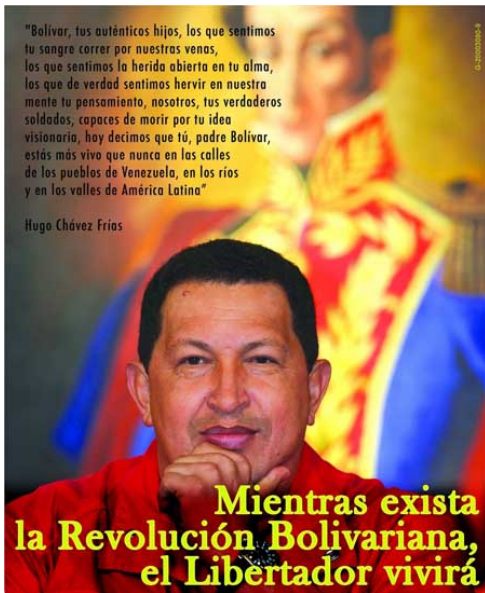
Imagen nro. 1.

Pino Iturrieta, 2003; Straka, 2009; Caballero, 2010). Pero si bien, como afirma Pino Iturrieta (2003), diferentes presidentes y “manipuladores de la política” desde 1842 honraron y divinizaron a Bolívar construyendo una “religión republicana”, es la construcción de la trama heroica de la Revolución Bolivariana liderada por Hugo Chávez la que resitúa a Bolívar en pleno siglo XXI en los altares sagrados de la patria y el culto popular 2 .