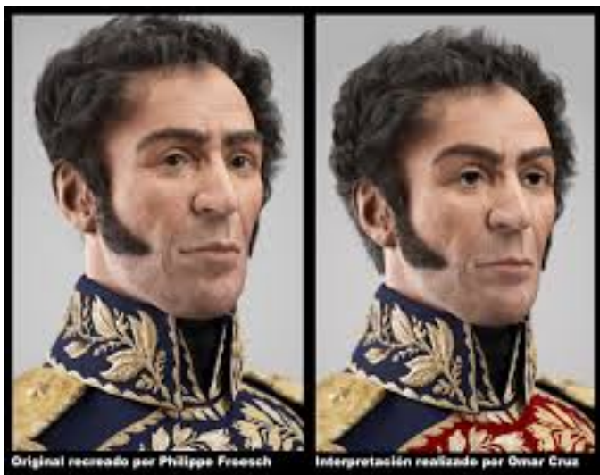
Imagen nro. 3. BUSCAR UNA IMAGEN CON MAYOR RESOLUCION