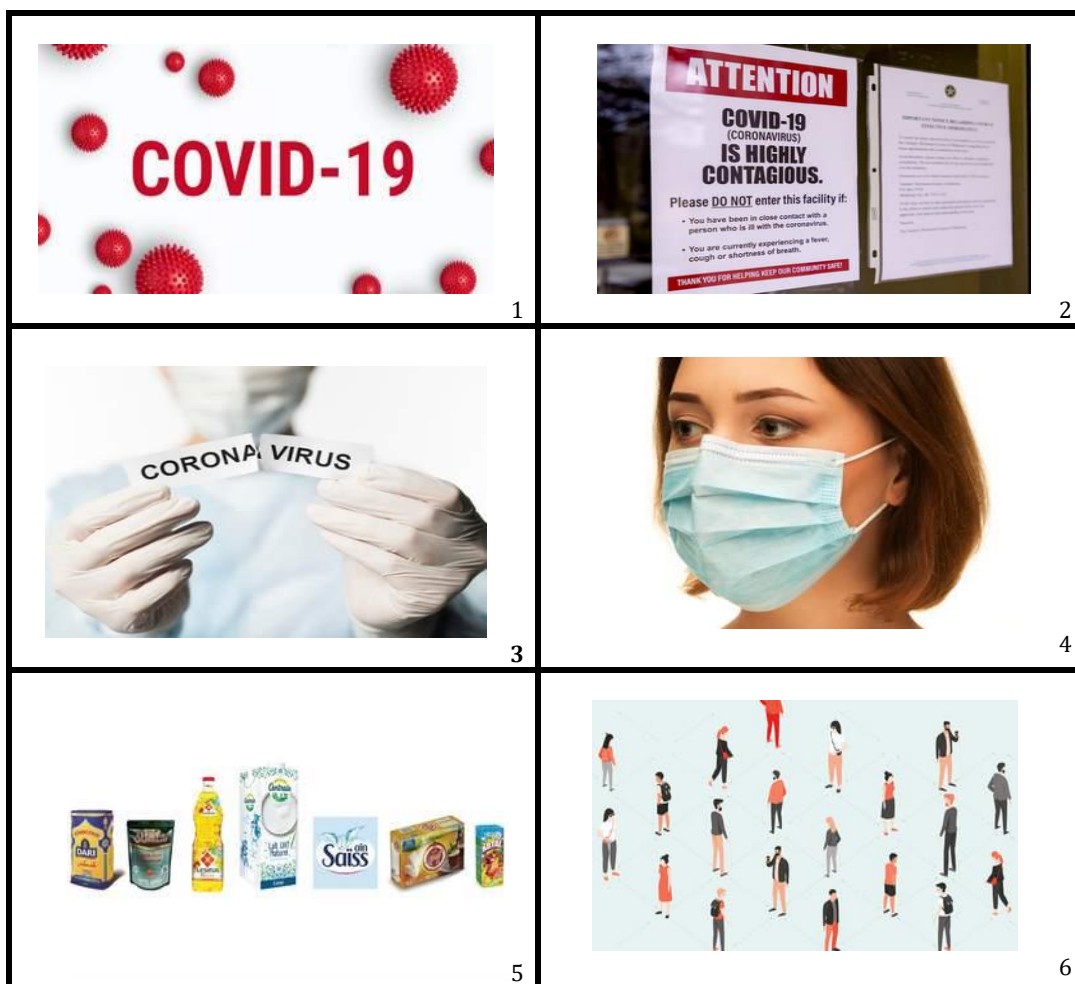
Gráfica 1 Profilaxis contra la corona virus

La profilaxis contra la pandemia de la COVID-19 (Ver imagen 1), por tratarse de un virus muy contagioso (2) y para romper la cadena de transmisión de la misma, se recomienda como básico el uso de guantes (3), mascarillas (4) y productos jabonosos para el frecuente aseo personal (5). También, no tocarse los ojos, la nariz, ni la boca. Asimismo, mantener una distancia social de aproximadamente dos metros (Mts. 2,00) entre las personas (6). De momento, no hay vacunas ni medicamentos para prevenir la infección, por tratarse de un virus nuevo, pero los enfermos deben recibir tratamiento para aligerar los síntomas.