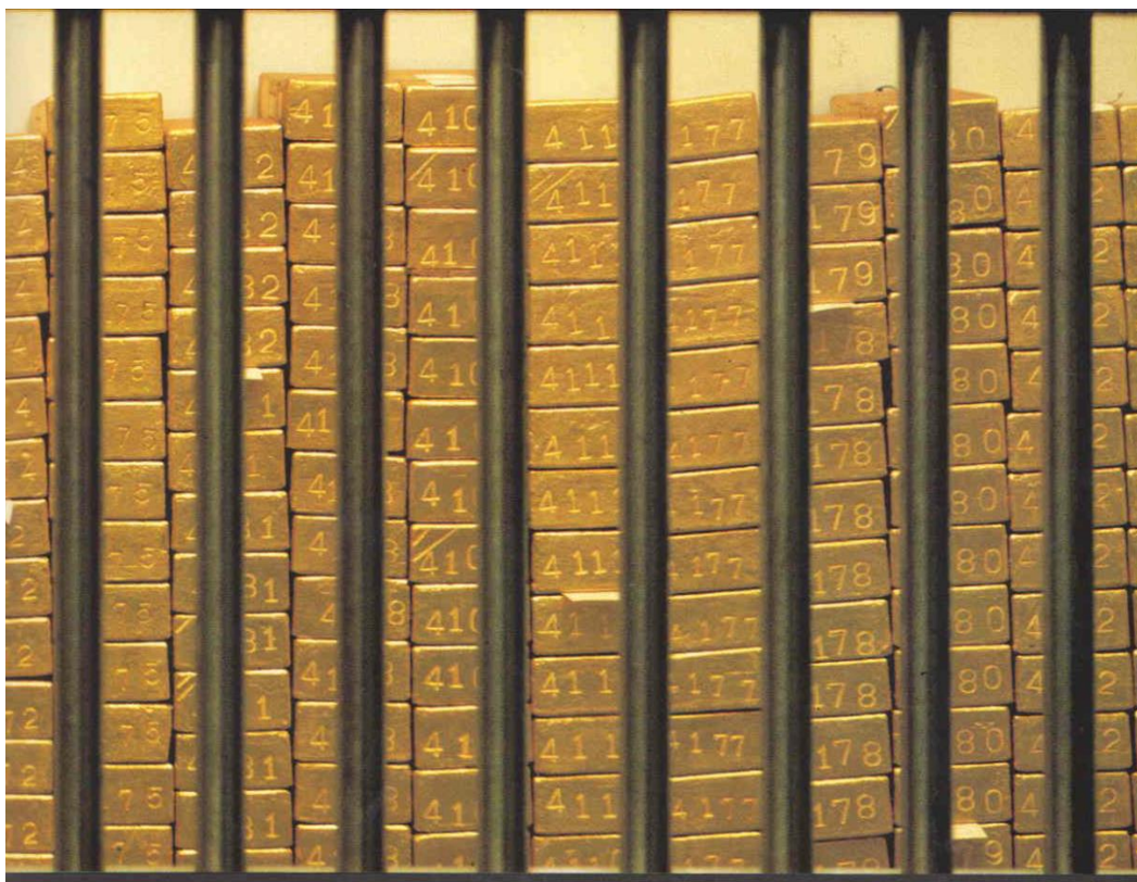
Gráfica 2 Lingotes de oro good delivery custodiados por el Banco Central de Venezuela

Los lingotes están depositados a 15 metros bajo tierra en una bóveda de seguridad especial, dotada de alarmas de tiempo, ruido, agua, fuego y electricidad; circulada por pasillos de seguridad debidamente enrejados con barrotes de acero; y, para llegar al sitio donde están apilados los lingotes, hay que pasar frente a cuatro garitas atendidas por guardias de seguridad, con sus medidas de prevención y correspondientes rejas de acero, luego de abrir la puerta de seguridad de la bóveda y franquear tres rejas de acero adicionales en el interior de la bóveda. Se apertura en forma programada, con la presencia del Superintendente de Bancos, un miembro del directorio, el auditor, el tesorero, el cajero principal de reservas y algunos miembros de personal auxiliar, debidamente seleccionados para realizar la tarea encomendada. Además, está monitoreada permanentemente mediante cámaras de seguridad, por personal especializado desde un sitio ad hoc .