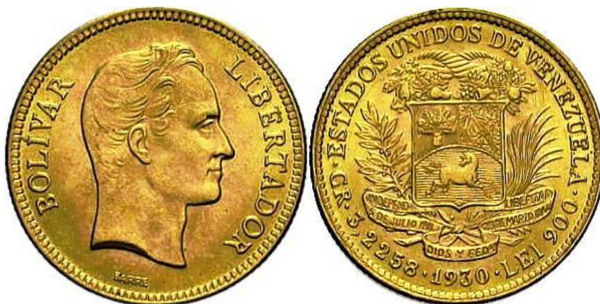
Gráfica 1 Moneda de oro de Bs. 10, conmemorativa del Centenario de la Muerte del Libertador Simón Bolívar

En el medio del campo del anverso, de perfil y mirando hacia la derecha, aparece la efigie del Libertador Simón Bolívar, circulado con las inscripciones: "BOLÍVAR" a la izquierda, "LIBERTADOR" a la derecha y "BARRE" debajo de la efigie. En el centro del reverso, el Escudo Nacional, circulado con las inscripciones: "ESTADOS UNIDOS DE VENEZUELA", "GR. 3,2258", "1930" y "LEI 900".