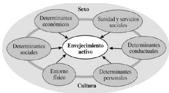
Figura 1. Determinantes del envejecimiento activo

Fuente: World Health Organization., 2002. Envejecimiento activo: un marco político