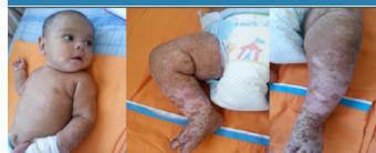
Figura 3. Láminas escamo-costrosas y zonas hipopigmentadas residuales.