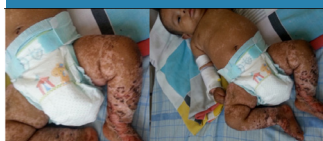
Figura 2. Descamación en grandes láminas escamo-costrosas.