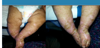
Figura 5. Mejoría clínica con zonas de re-epitelización y escamas residuales.