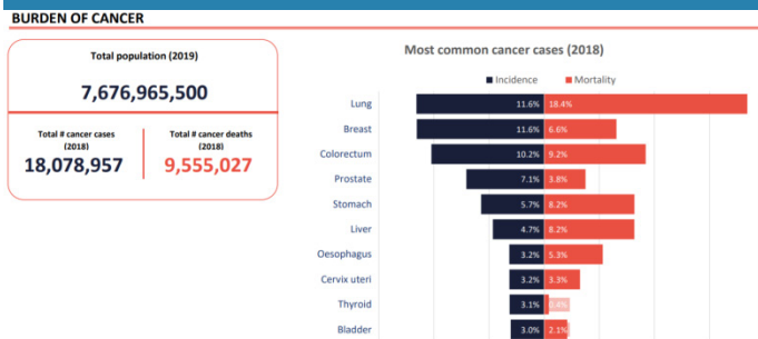
Figura 2. Representación pictórica de estadísticas mundiales relativas a la carga del cáncer, destacando el cáncer de mamá en segundo lugar 1 .

Por otra parte, según la Organización Panamericana de la Salud (OPS), para el 2018 el cáncer en el continente americano es liderado por el cáncer de mamá, tanto en incidencia como en mortalidad, en la mayoría de los países que lo conforman (Ver Tabla 1), superando abiertamente cánceres como los de próstata, hígado y pulmón entre otros 5 . En ella se aprecia que Guyana lidera la incidencia y las Bahamas encabezan la mortalidad en el concierto americano.