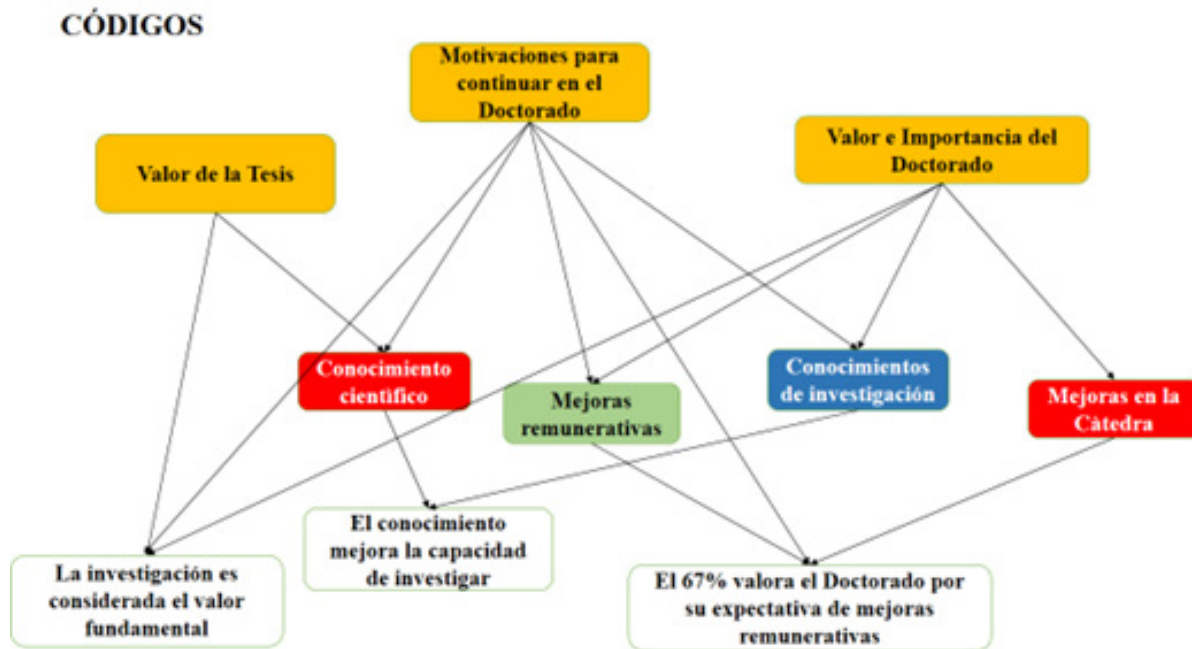
Figura 1. Temas seleccionados

En la Figura 1, se muestran los temas que se plantearon, (mostradas en color anaranjado): valor de la tesis, motivaciones para continuar en el doctorado y valor e importancia del doctorado. Se desprenden en colores rojo, verde y azul, los códigos transversales que se extrajeron de las entrevistas a profundidad, estos son: el conocimiento científico, la mejora remunerativa, conocimientos de investigación y mejoras en la cátedra. Por último, en color blanco se presentan las conclusiones del análisis.