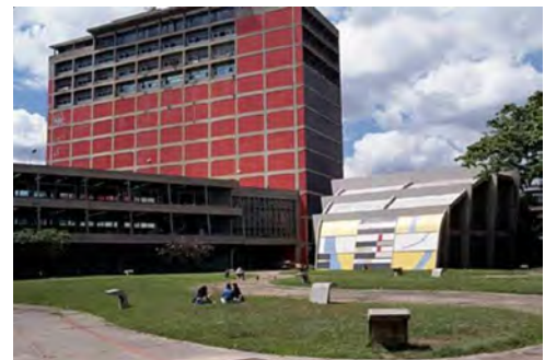
Gráfico 5. Tierra de nadie y la Biblioteca Central.