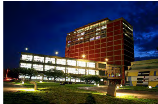
Gráfico 3. Biblioteca Central de noche.

La Biblioteca Central es la protagonista en el día a día del estudiante ucevista, espacio que no solo alberga conocimiento sino que incentiva la investigación y la curiosidad, además de fomentar el crecimiento cultural al ofrecer exposiciones artísticas que varían constantemente y generan espacios de interacción social que promueven la creación del conocimiento.