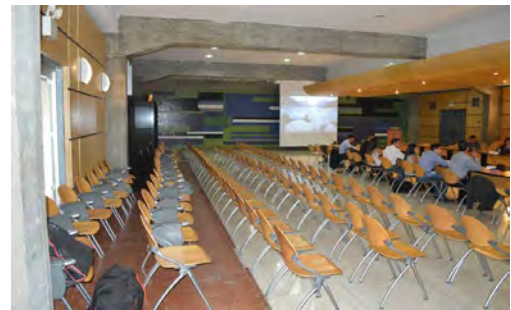
Gráfico 4. Sala E.