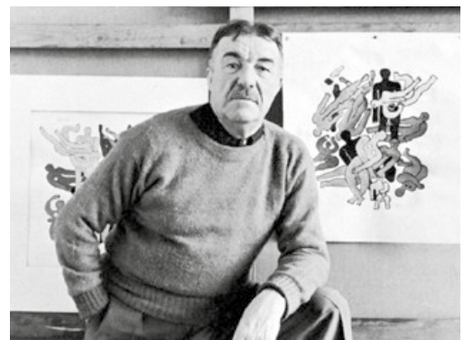
Gráfico 2. Fernand Léger.