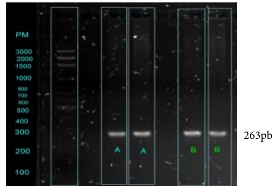
Figura N° 1. Productos amplificados por PCR del gen de IRS1. El carril 1 corresponde al marcador de tamaño molecular de 100 pb (Promega). Los carriles identificados como A y B corresponden a los productos amplificados del gen IRS1 (263 pb).

Como se observa en la Tabla N°2, en los dos grupos estudiados, sólo se observó la presencia de dos (Gly/Gly, Gly/Arg) de los tres genotipos posibles (Gly/Gly, Gly/Arg, Arg/Arg). Presentando el genotipo heterocigoto Gly/Arg una frecuencia incrementada en los adultos obesos con respecto al grupo control 0,34 vs. 0,17, respectivamente, OR: 2,51; IC 95%: 1,27-4,97; p: 0,002 ; pc: 0,004 ]. En contraste, se observó una frecuencia incrementada del genotipo homocigoto