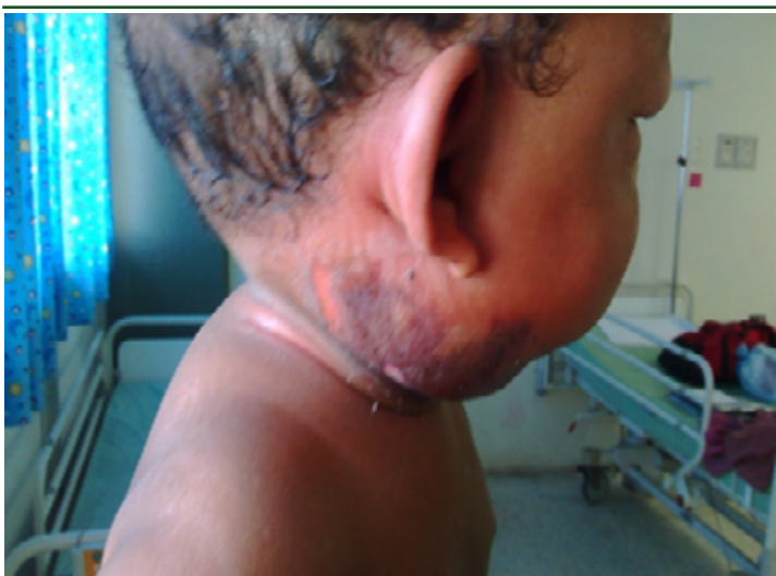
Figura 3: Día 14 de evolución intrahospitalaria. Mejoría del área necrótica con cicatrización parcial.

alteración del estado general por lo que se ingresa con el diagnóstico de: celulitis post-traumática en región laterocervical izquierda. Al tercer día de hospitalización la lesión inicial evoluciona de una zona indurada y roja a áreas violáceas y necróticas con empeoramiento del estado general planteándose el diagnóstico de Fascitis Necrotizante (FN) (Ver figura 1).