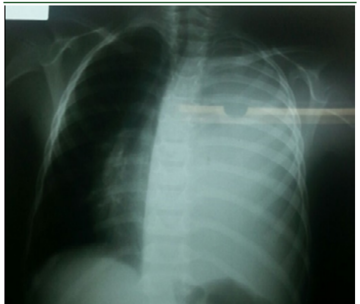
Figura 4: Radiografía en proyección anteroposterior. Opacidad homogénea desde el vértice hasta la base, que ocupa todo el hemitórax izquierdo con desplazamiento del cardiome-diastino contralateral.

La condición local de isquemia y destrucción puede interferir con el suministro adecuado del antibiótico al área involucrada por lo que el desbridamiento de la zona se hace imperativo [7].