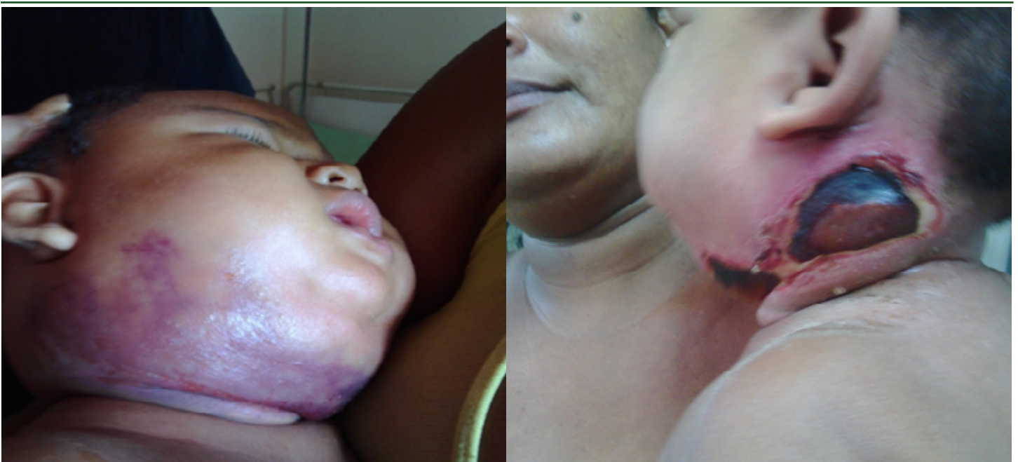
Figura 1: (der) Tercer día de hospitalización: Edema facial cervical con cambios tróficos locales, momento en el que se plantea diagnóstico de FN. Figura 2: (izq) Séptimo día de hospitalización. Área de necrosis localizada

Nuestro primer caso, un lactante menor masculino de 8 meses de edad previamente sano, quien acude a nuestro servicio por presentar cambios de coloración y aumento de volumen acompañado de zona de induración en región laterocervical izquierda posterior a presentar traumatismo directo (al caer desde la silla donde se encontraba sentado) asociándose al tercer día fiebre y