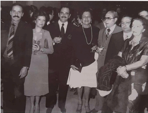
Evento social en Congreso de la SOGV.