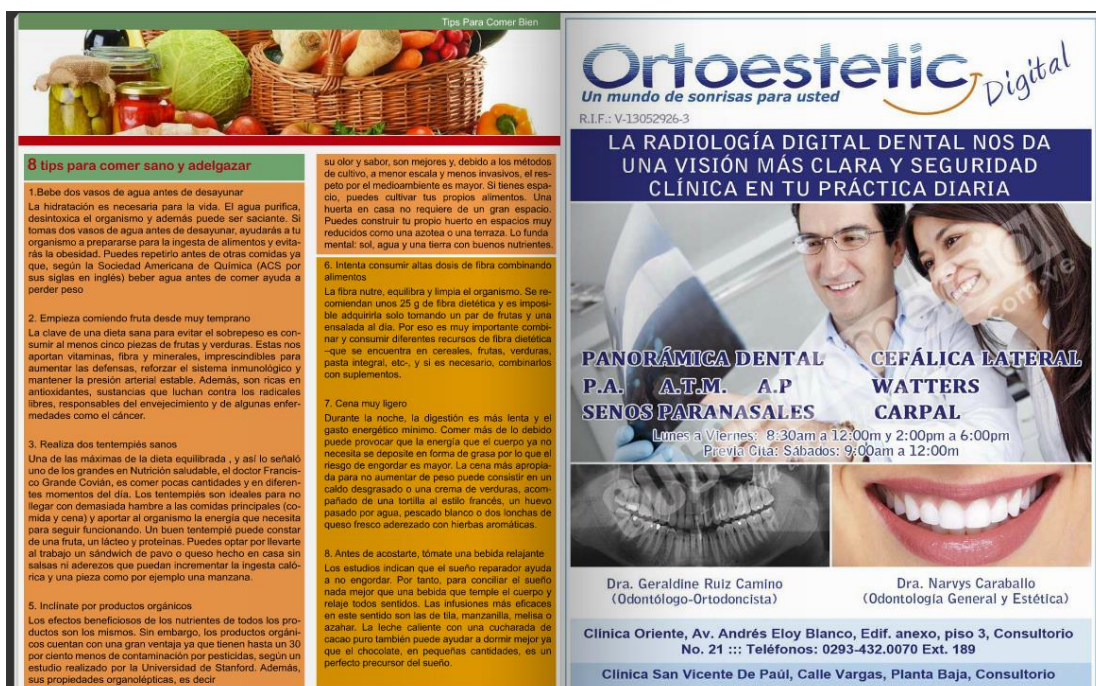
Figura 8. Ejemplo de Artículos; Sección Tips Para Comer Bien