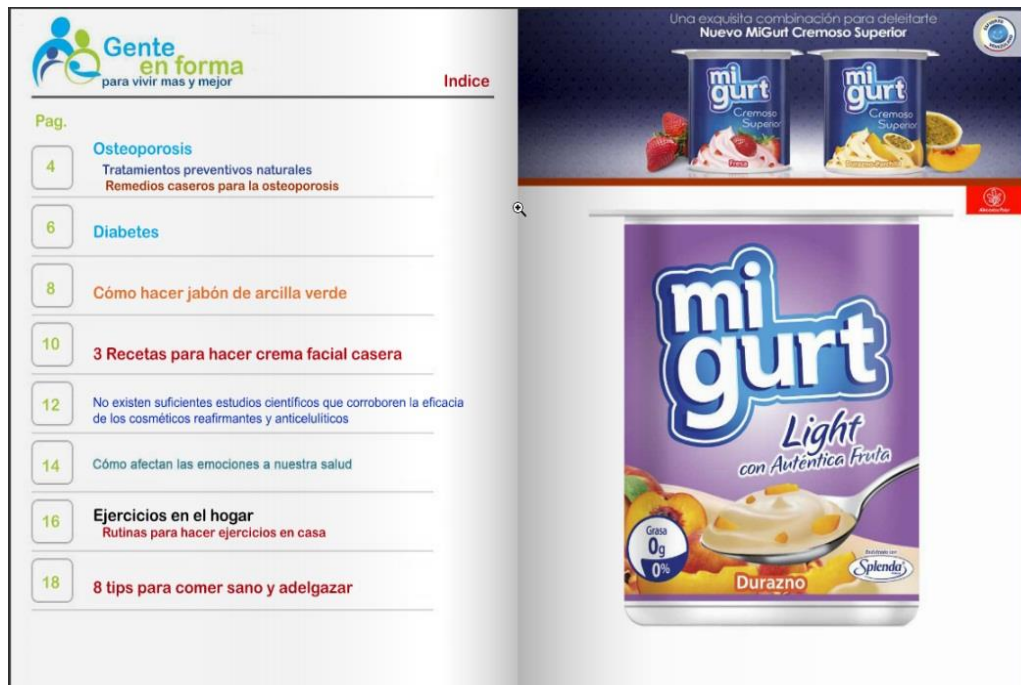
Figura 3. Primera Página y ejemplo de publicidad