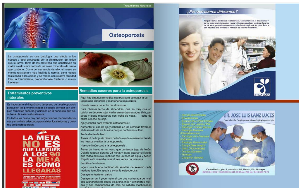
Figura 4. Ejemplo de Artículos; Sección Tratamientos Naturales