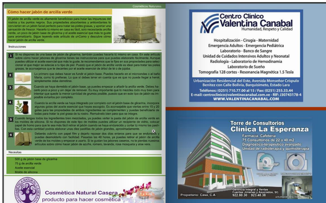
Figura 5. Ejemplo de Artículos; Sección Cosméticos Naturales