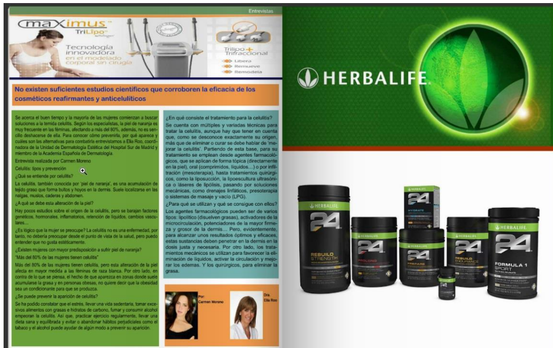
Figura 6. Ejemplo de Artículos; Sección Entrevistas