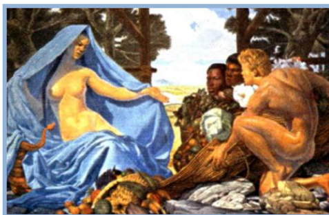
Pintura de Pedro Centeno Vallenilla “María Lionza”