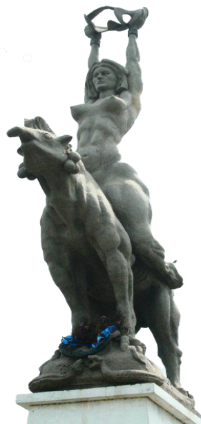
Escultura " María Lionza " de Alejandro Colina