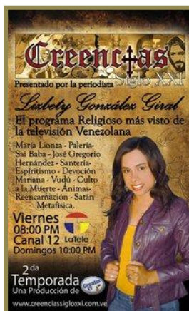
Grabación de Programa Televisivo “Creencias Siglo XXI – Corte India”