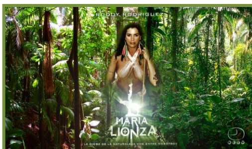
Película de ficción realizada por Rómulo Guardia “María Lionza”