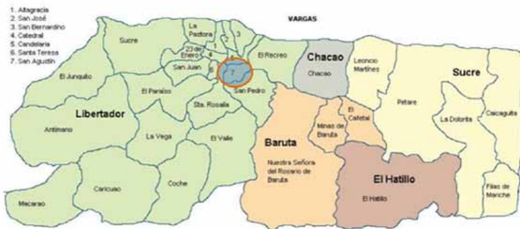
Figura 1: Localización de la Parroquia San Agustín en la ciudad de Caracas