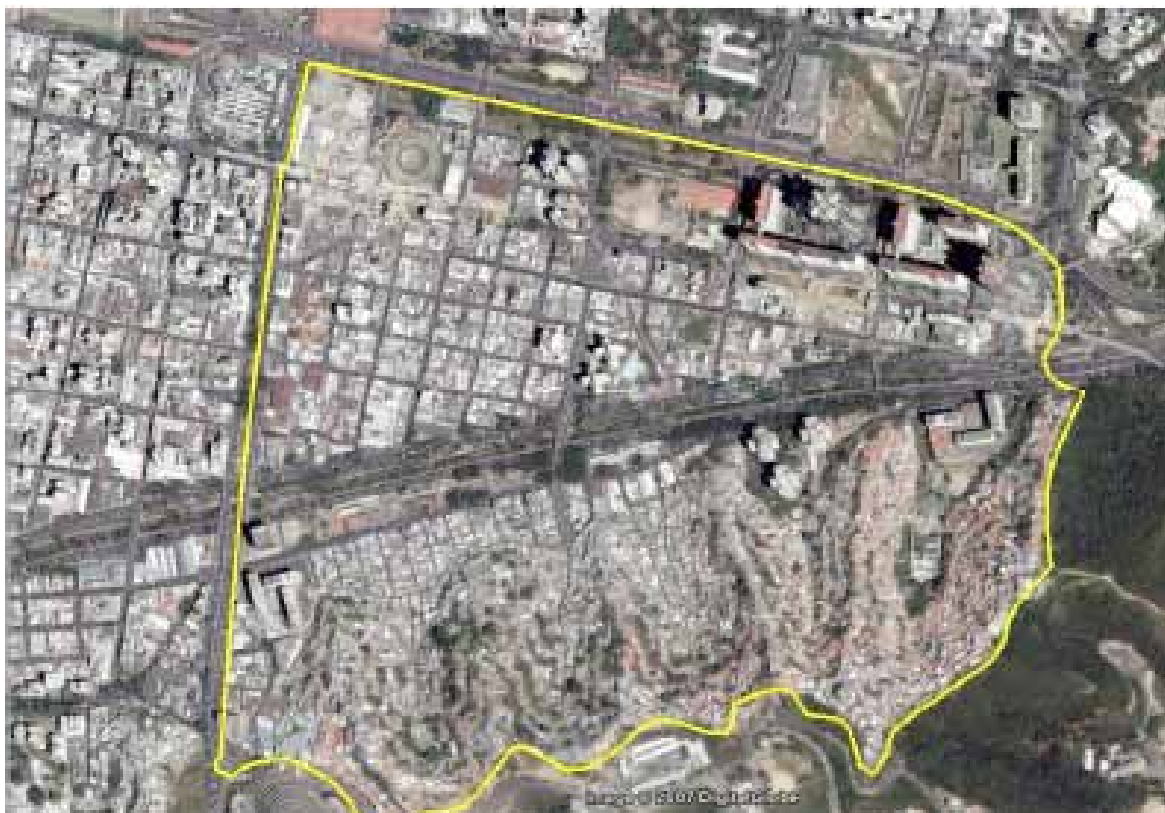
Figura 2: Vista aérea de la Parroquia San Agustín

Con respecto al Distrito Metropolitano de Caracas, San Agustín del Norte presenta excelente ubicación y accesibilidad hacia el centro de la Ciudad, así como conexión directa hacia el oeste y este de la misma. Sin embargo, San Agustín del Sur no posee tales ventajas debido a que se encuentra confinado entre la Av. Fuerzas Armadas y el Helicoide por el oeste, el Jardín Botánico por el este y el sector informal por la parte