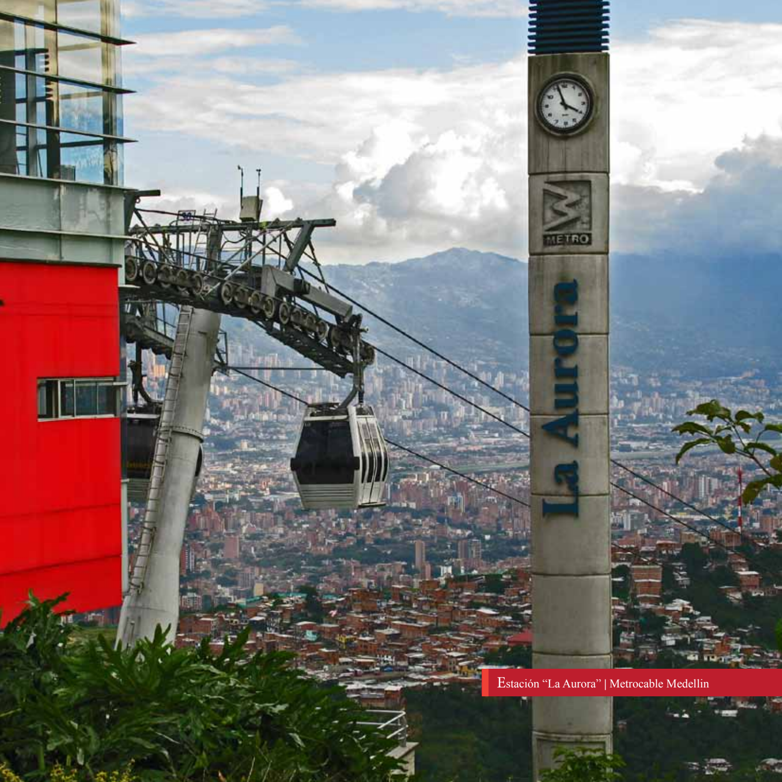
Estación "La Aurora" | Metrocable Medellín