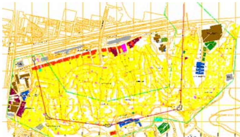
Figura 3: Trazado del MetroCable San Agustín

▪ “El proyecto persigue mejorar la calidad de vida de los habitantes de las zonas atendidas, así como contribuir con la redistribución de la población sobre el espacio, propiciando la inserción de los planes del Ministerio de Vivienda y Hábitat en las zonas poco favorecidas económicamente”.