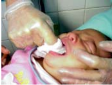
Figura 1.35. Demostración técnica de higiene bucal.