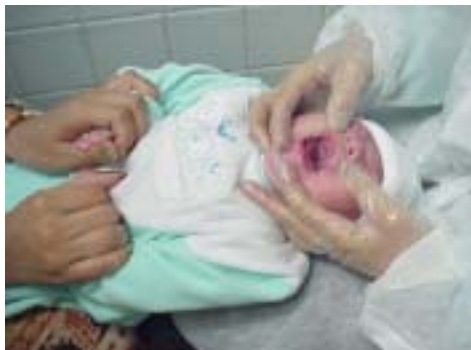
Figura 1.34. Examen de la cavidad bucal en niño VIH(+)