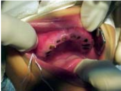
Figura 1.33. Niño VIH (+) que presenta caries rampante