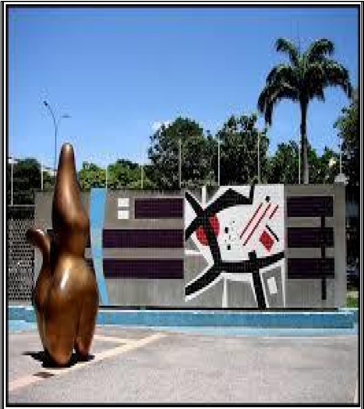
Pastor de nubes de Arp y mural Autor: Mateo Manaure U.C.V