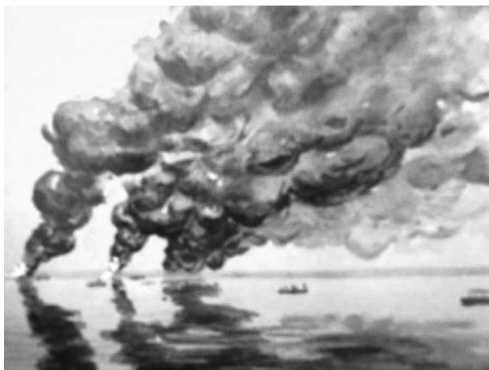
Incendio de petróleo en el lago de Maracaibo, 31 de mayo de 1935.