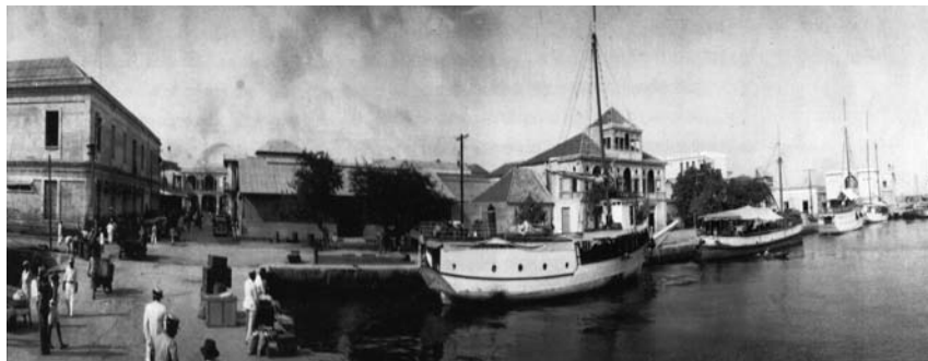
Puerto de Maracaibo.