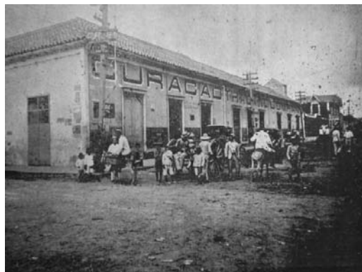
“Frente y un costado del amplio edificio que ocupa en Maracaibo la Curaçao Trading Company”. Revista Mercantil . Maracaibo, año III, nº 24, mes XXIV, 30 de junio de 1924, p. 473.

menor calado, que les permitiese pasar la barra de Maracaibo. Para ello, se encontraban “...Los vapores ‘Baralt’ y ‘Brión’ con salidas semanales de ambos puertos [Curaçao-Maracaibo], asegurándose así con la navegación de estos vapores el enlace directo con los vapores de las líneas de Europa y New York. [además] Los vapores ‘Baralt’ y ‘Brión’, así como el ‘Astrea’, ‘Flora’, ‘Carna’, ‘Amazone’ y ‘Medea’...” 2 , eran vapores de carga, pero tenían comodidades para algunos pasajeros.