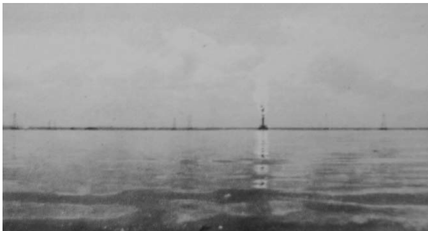
Incendio de la torre petrolera.