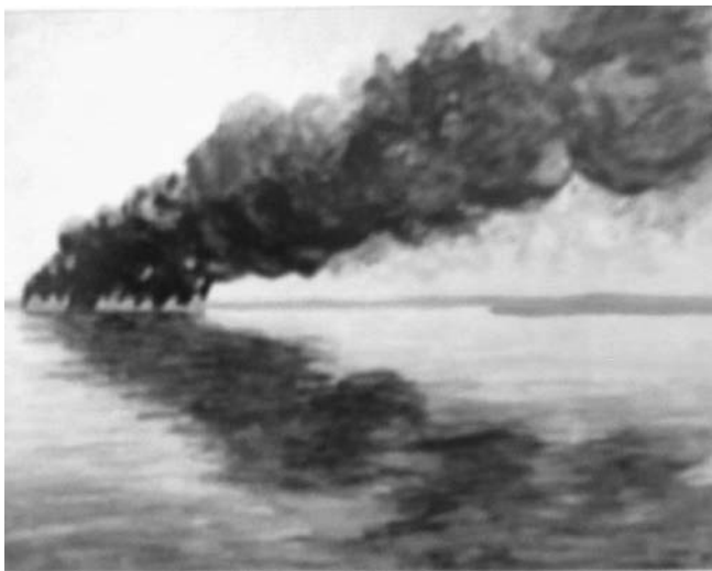
Incendio de petróleo en el lago de Maracaibo, 31 de mayo de 1935. Tomado de Acuarelas y relatos de Julia Bornhorst, p. 67.

—el petróleo—. Afortunadamente, la actividad desplegada por las autoridades, La Venezuela Gulf Oil, La V.O.C, la Lago Petroleum y algunos particulares esforzados impidió que el fuego se propagara a la población de tierra. Los continuos incendios de las torres de petróleo dentro del lago, se debían a que esta era una nueva actividad impulsada por la Lago Petroleum Corporation, cuyos campos se desarrollaron en torno a la explotación de petróleo aguas adentro. Para la extracción de petróleo dentro del Lago, se utilizaban “... diversos tipos de bases (...) la anticuada armazón de madera, la cual, habiendo resultado muy costosa y poco satisfactoria para los sitios profundos fue reemplazada por pilotes de madera...” 28 . El uso de la madera en la extracción de petróleo dentro del lago era un elemento de fácil combustión que influía en que se produjeran los continuos incendios de las torres petroleras. Pos-