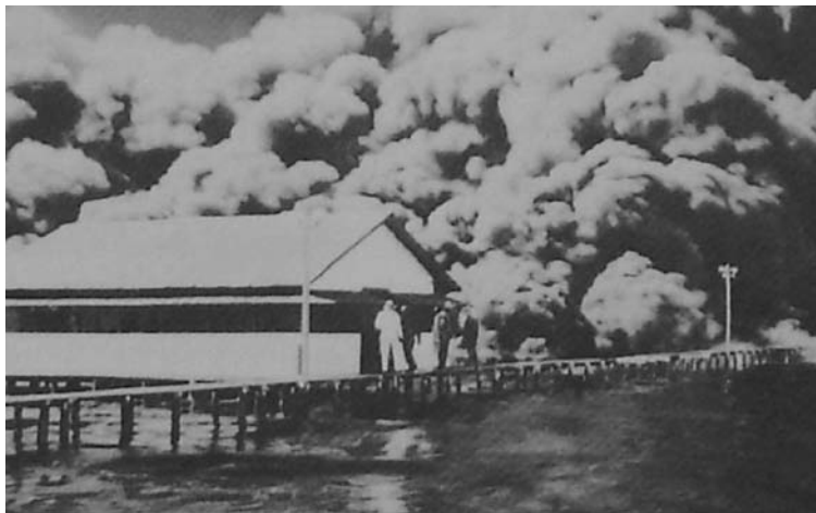
Fotografía realizada por Carl Bornhorst durante el incendio de la torre petrolera.

Tomado de Acuarelas y relatos de Julia Bornhorst, p. 39.