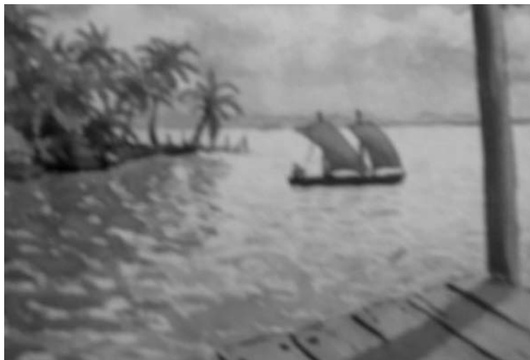
Vista desde la “casita” del Hato Hamburgo Tomado de Acuarelas y relatos de Julia Bornhorst, p. 65.