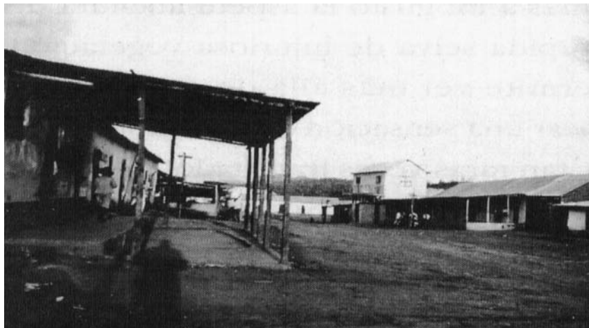
Mene de Mauroa. Pueblo de planchas de zinc creado por el boom petrolero . Tomado de Acuarelas y relatos de Julia Bornhorst, p. 54.

de distracción que no existían de manera evidente antes de la llegada de los petroleros. Es decir, la prostitución se hizo más pública y evidente en los centros urbanos.