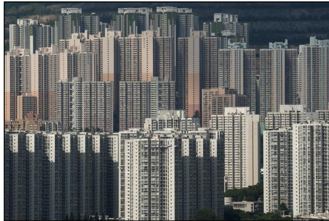
Figura 6. Bloques de viviendas públicas y privadas en Hong Kong, China. 2016.

Posteriores a las guerras mundiales, especialmente Europa se vio en la imperiosa necesidad de construir viviendas masivamente para restaurar sus ciudades y darle albergue a quienes lo habían perdido. Ese fue un detonante del crecimiento de este tipo de edificaciones.