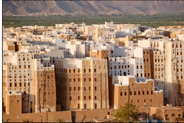
Figura 3. Ciudad de Shibam, Yemen. Construida en el año 1532 aproximadamente.

Con la llegada de la Revolución industrial y los avances tecnológicos y científicos que esta generó, las agrupaciones de vivienda se hicieron cada vez más comunes, sobre todo en los centros urbanos que atraían cada vez más habitantes. Las nuevas técnicas constructivas como el uso masivo del concreto armado y el acero estructural y la aparición del ascensor permitieron ir aumentando progresivamente los pisos de los edificios residenciales.