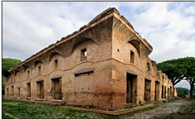
Figura 2. Restos de un insulae romano ubicado en el yacimiento de Ostia Antica, Italia, construido aproximadamente en el siglo IV a. C.

Desde los insulae de la Roma antigua se pueden apreciar la agrupación de unidades mínimas de viviendas para aquellos ciudadanos de bajos recursos que no podían costear una vivienda aislada y propia, y por ende se reunían para vivir y así compartir no sólo los espacios sino los gastos. (Ver figura 2).