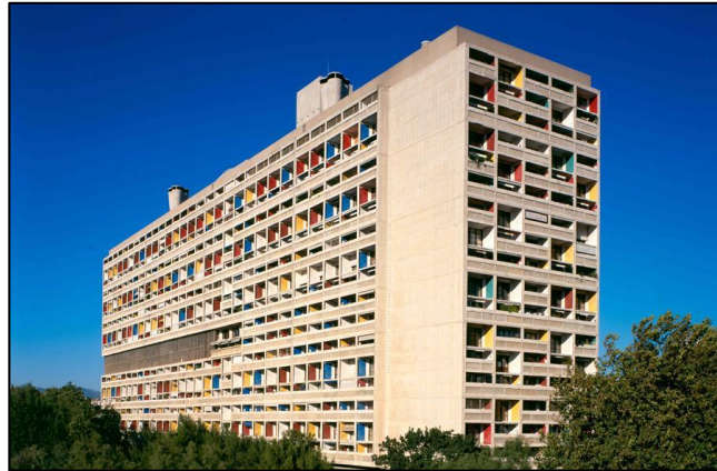
Figura 5. Unidad Habitacional de Marsella. Diseñada por Le Corbusier y construida en 1952 en Sainte-Anne, Francia.