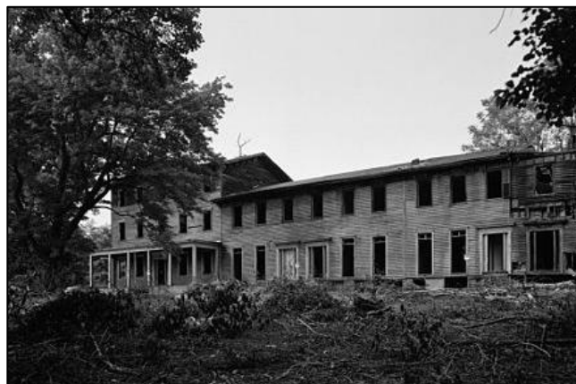
Figura 4. Vista externa del falansterio en el Condado de Monmouth, Nueva Jersey, EE.UU, construido en 1846.

Desde finales del siglo XIX hasta un poco más de la mitad del siglo XX se probaron ideas de agrupaciones de vivienda, desde los fracasados falansterios (ver figura 4), pasando por los planteamientos modernos expresados en edificios como La Unidad Habitacional de Marsella de Le Corbusier (ver figura 5), hasta los excesivos conjuntos residenciales de China. (Ver figura 6).