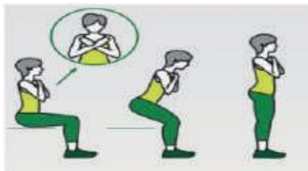
Figura 3. Fuerza y la resistencia de las piernas.

Este test de Resistencia de la parte baja inferior de cuerpo se valoriza según lo que establecieron Golding, Myers & Sinning (1986), en el cual categorizan tanto a los hombres como las mujeres por grupos etarios en renglones que van desde muy deficiente hasta excelente. El IMC, fue calculado por la fórmula: (\text{Peso}-k)^2 / \text{Altura}-M . clasificándose según lo que refiere la OMS (2021) : Los trabajadores se clasificaron en las categorías de “peso normal” y “sobrepeso” utilizando los puntos de corte para el IMC (18,5 a 24,9 kg / m 2 para el peso normal y 25 a 29,9 kg / m 2 para el sobrepeso. Por otra parte, para establecer la Capacidad Aeróbica Relativa (CAR) y tener un comparativo con la aptitud física, se estimó a través de la ecuación (1) modelo por Uth, Sorensen, Overgaard & Pedersen (2003) y ecuación (2) Inbar et al., (1994):