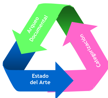
Figura 2. Triangulación