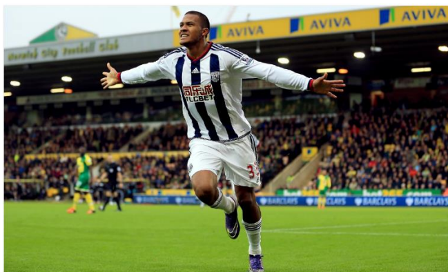
Salomón Rondón: de Catia a Inglaterra