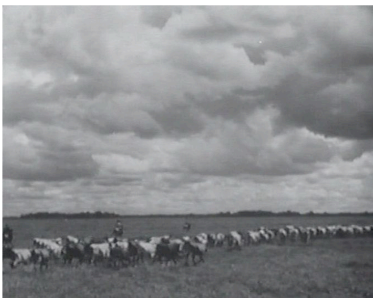
El cielo infinito sobre los personajes durante el arreo de ganado.

La elaboración expresiva de la película se fundamenta en una puesta en escena cuya escenografía es el paisaje llanero. Pocas escenas se desarrollan en espacios interiores (la casa de los padres de José, la casa de su abuela) o en escenarios construidos por el hombre (el pueblo). Los elementos del paisaje llanero definen el espacio con su característica apertura a un cielo que luce infinito sobre las cabezas de los personajes: la línea recta del horizonte como en la imagen del arreo de ganado; la vegetación, los ríos, los esteros y lagunas; la fauna silvestre compuesta por babas, galápagos, garzas y serpientes; los animales de cría como las vacas y los caballos. Los personajes atraviesan este espacio abierto con pocas restricciones más allá de las que imponen el tiempo de lluvias o la sequía. En la representación, la naturaleza predomina sobre la cultura.