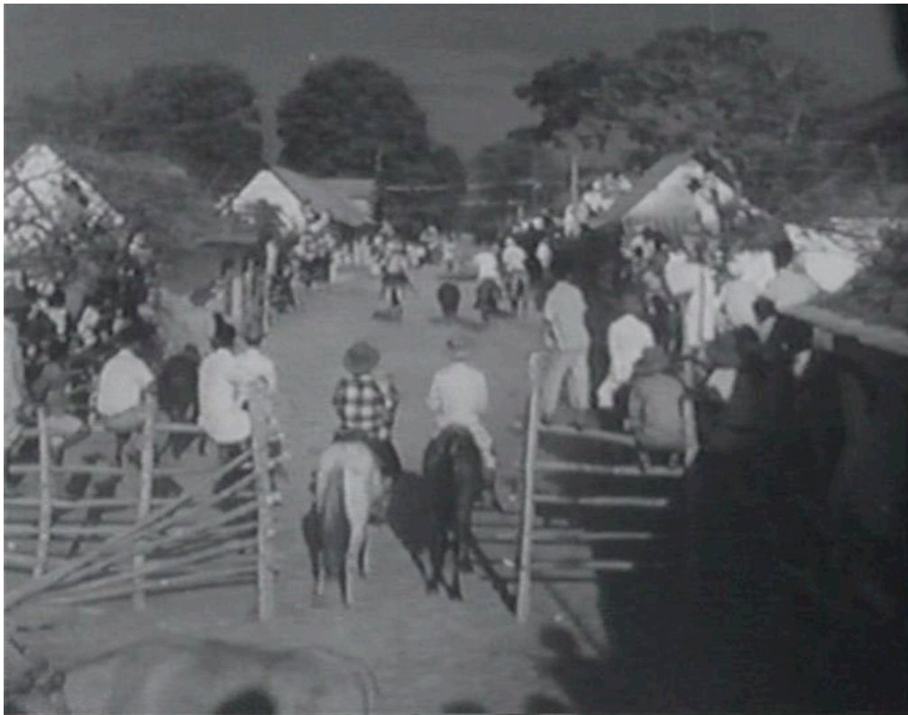
Las fiestas patronales

A medida que se alternan la sequía y las lluvias, transcurren las actividades propias del hato: el pastoreo del ganado vacuno, la caza de animales silvestres, el marcaje del ganado, la doma de los caballos. José y Aparicio recorren el llano y participan en las actividades familiares y comunales, así como en las fiestas patronales de un pueblo cercano mostradas en la imagen de abajo. Hacia el final del documental, se destaca que los productos del hato, en especial la carne, son transportados a los mercados de Caracas, la capital del país, por vía aérea. El film concluye recordándonos que el ciclo de las dos estaciones del llano se repite de idéntica manera un año tras otro y que así transcurre la vida de los personajes que lo habitan.