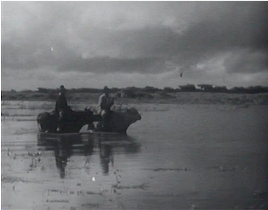
Los personajes enmarcados por el paisaje.

Además de estar determinado por los ciclos de la naturaleza, el modo de vida de los llaneros aparece como el de pequeñas comunidades familiares (la familia de José) y étnicas (el grupo yaruro de Aparicio). El pueblo cercano parece un lugar de reunión en ocasiones como las fiestas patronales. La actividad económica se centra en el hato: aunque las relaciones laborales y de poder no aparecen claramente delineadas, los llaneros son mostrados como peones de la hacienda. La vida de la región gira alrededor de la ganadería para abastecer a Caracas, la capital del país.