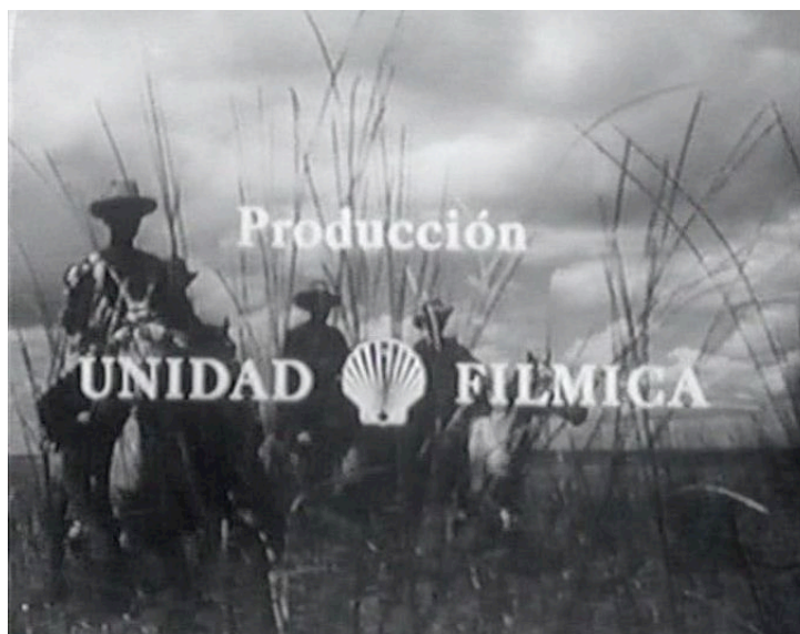
Créditos iniciales de Llano adentro .

iniciales, como puede verse en la imagen a continuación.