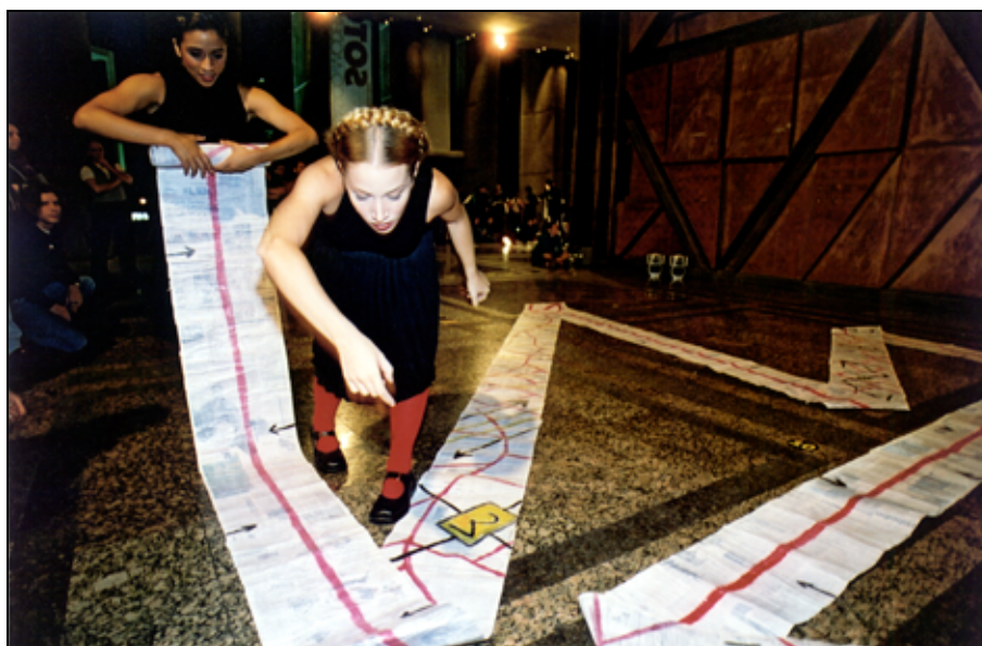
Imagen N° 6