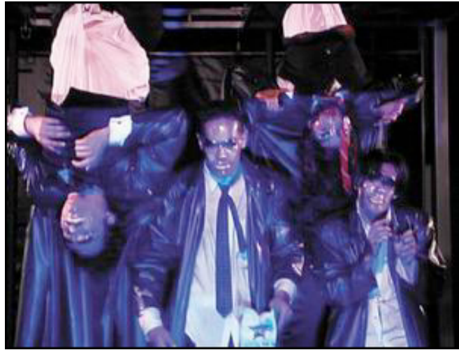
Imagen N° 7

Los habitantes de estos sectores altamente empobrecidos, enfrentados a la desestructuración económica y social de las ciudades latinoamericanas, los habitantes de los barrios populares han desarrollado una serie de mecanismos destinados a responder en el aquí y ahora a sus problemas más urgentes como alimentación y servicios. El conjunto de esas estrategias, experiencias, estilos de vida, códigos, lenguajes, etc., se conocen como la cultura de urgencia , la cultura urbana en estado de angustia. La manifestación de esta cultura se encuentra en todas las actividades informales desarrolladas por los sectores populares urbanos.