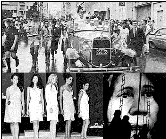
Imagen N° 4

Por ello, en 1968, la estrategia de moda era el happening , el cual explicamos con anterioridad, pero del que podemos decir que busca experimentar y producir una obra de arte que no se focaliza en objetos sino en el evento a organizar y la participación de los espectadores, para que dejen de ser sujetos pasivos y, con su actividad, alcancen una liberación a través de la expresión emotiva y la representación colectiva.