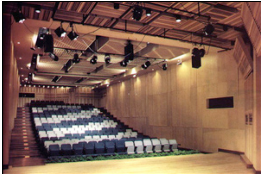
Imagen N° 11

caraqueños, como un espacio alternativo de fácil acceso y la relativa tranquilidad del municipio.