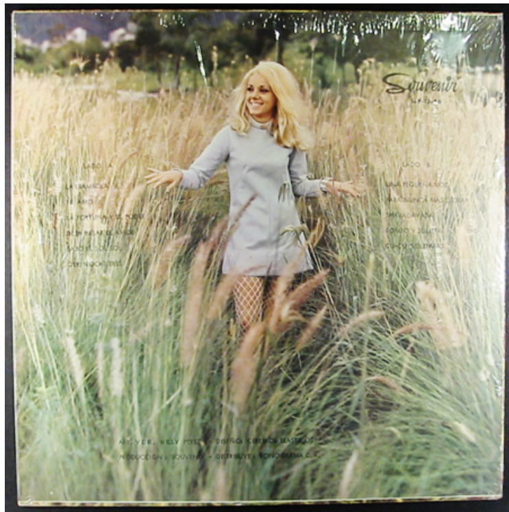
Imagen N° 1

Asimismo, la multiplicación de canales de televisión ofrece cada vez mayor variedad al consumidor cultural. Además de la amplia oferta de la televisión por cable y el mismo Internet. Caracas tiene pues, un amplio abanico de posibilidades para la difusión, absorción y retroalimentación cultural. Ahora bien, la cultura urbana es la posibilidad de que lo normal o cotidiano se vuelva parte de un proceso de superación social.