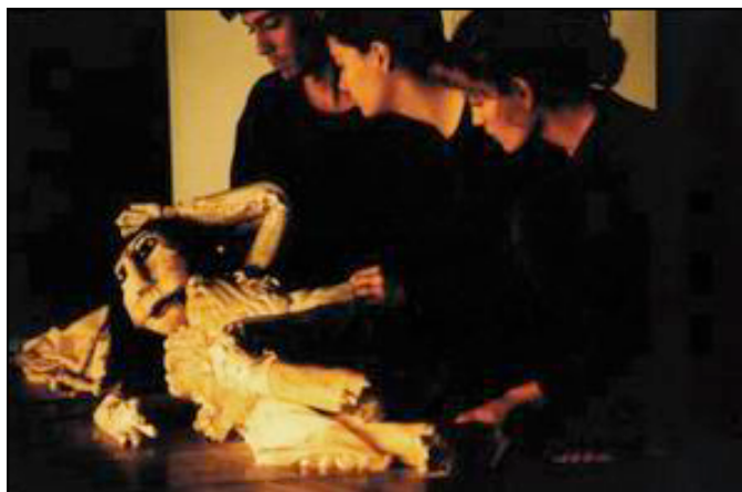
Imagen N° 10