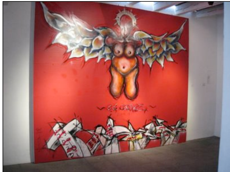
Imagen N° 2

Podría decirse que es una forma de vida totalmente particular para quienes hacen de una pared un lienzo y de unos potes de spray un pincel. El grafiti es una reacción al entorno. Las ciudades están rodeadas de anuncios y señales; y de allí surge el arte urbano; todos luchan por captar la atención del público. Logrando un caos visual en las calles pero creando la cultura urbana.