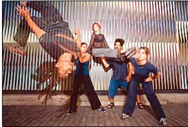
Imagen N° 9