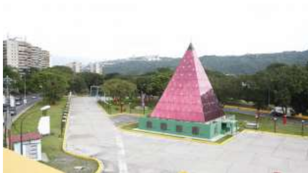
Figura No 1. Pirámide de cristal en la isla de la autopista Valle-Coche.

La isla de la autopista Valle-Coche era una zona verde que a pesar de estar ubicada frente a los edificios de la Escuela de Guardias Nacionales y ser paso obligatorio para el acceso por la alcabala No 3, al principal Fuerte militar de Venezuela, durante años se había convertido en un depósito a cielo abierto de escombros, residuos sólidos y otros materiales provenientes de demolición de construcciones que no eran precisamente de esa localidad. Ésta obra fue la primera intervención donde se talaron árboles, mediante aserrado y la isla central de la autopista paso de ser un área verde arborizada a una calle de concreto que serviría para la entrada y salida de unidades de radiopatrullas hacia la vía rápida en el sentido a Plaza Venezuela.