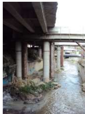
Figura No 22. Detalles de malos acabados y daños ocasionados al embaulamiento por columnas en el río El Valle vistas desde el puente Bellas Artes cruce con Av. La Facultad.