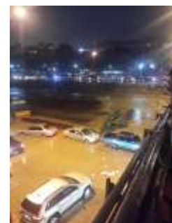
Figura No 18. Inundación de la Valle-Coche por desbordamiento del río El Valle vistas a la altura de la Bandera.