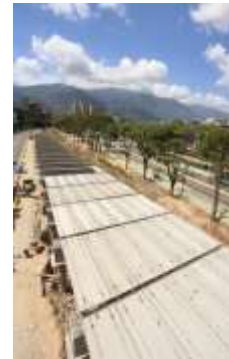
Figura No 16. Resultado de la cobertura aplicada al cauce del río El Valle, a la altura del Paseo Los Ilustres..