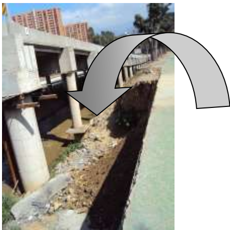
Figura No 21. Malas terminaciones en los elementos estructurales de la ampliación ejecutada a la altura del Paseo Los Ilustres.