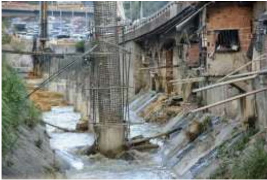
Figura No 14. Daños ocasionados al embaulamiento por columnas en el río El Valle vistas desde la Av. Bellas Artes cruce con Av. La Facultad.