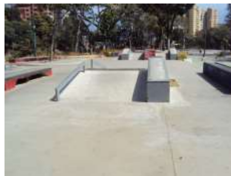
Figura No 6. . Pista de patinaje del Paseo Los Ilustres.