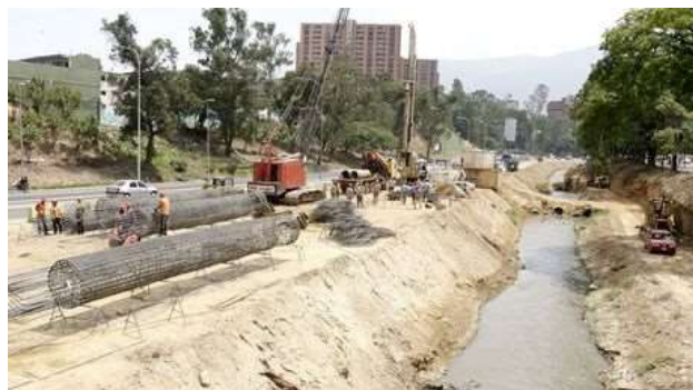
Figura No 10. Daños evidentes en las orillas del río El Valle como parte de las obras de ampliación de la Valle-Coche.

manual y maquinarias entre 850 a 1300 árboles 47 frondosos, adultos, sanos, que formaban parte del paisaje natural urbano de la ciudad capital.