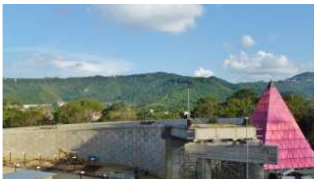
Figura No 7. Fase de construcción de la rampa de conexión con los túneles de la autopista Valle-Coche.

Una nueva obra fue realizada en la isla del km 0, donde años atrás fue construida la pirámide de cristal rosado (figura 7). Esta vez se trata de una rampa de acceso vehicular para el traslado de tránsito vehicular hacia los túneles que conectan la autopista Valle-Coche con el sentido al Cementerio y construida con la finalidad de evitar el retorno que anteriormente obligaba a llegar hasta el distribuidor la Gaviota ahorrando 1.8 km de recorrido.