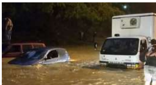
Figura No 17. Inundación en la Valle-Coche por desbordamiento del río El Valle, 25/agosto/2015 a la altura de Santa Mónica.

La tarde del 25/agosto/2015, estando aun sin concluir los trabajos de ampliación, la autopista Valle-Coche resintió una inundación que dejó paralizada la vialidad (figuras 17 y 18), causando un embotellamiento del tráfico y pérdidas materiales en vehículos particulares.