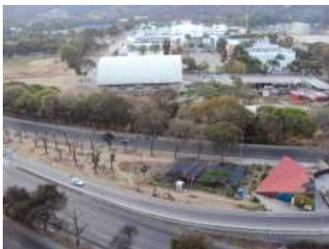
Figura No 2. Condiciones actuales de la isla de la autopista Valle-Coche, al fondo el patio de Honor de la Academia Militar de la Guardia Nacional Bolivariana de Venezuela

Las condiciones actuales de esta “área verde” presentan uno terreno que ha sido privatizado por cientos de metros de paredes, que sirve de depósito de materiales de construcción y allí fueron trasplantados apenas 26 árboles provenientes de las obras de ampliación realizada en el año 2015 (figura 2).