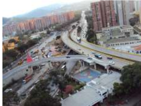
Figura No 8. Rampa de conexión con los túneles de la autopista Valle-Coche.

La intersección de la rampa con el puente ya existente al no disponer de un sobreechanco reglamentario de incorporación ha sido causante de múltiples accidentes (figura 8).