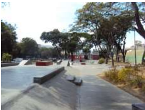
Figura No 5. Vista de la pista de patinaje del Paseo Los Ilustres.

Desde hacía años los habitantes de la ciudad Capital reclamaban destinar un espacio para la actividad de recreación de los jóvenes patinadores. Sin embargo, esta no fue la mejor opción ya que con esta intervención se destruyó parcialmente la arborización mantenida por más de 40 años. Caobos y cedros fueron talados y se modificó el área protectora y retiro del río El Valle para otorgarle un destino absurdo a una de las obras emblemáticas de Caracas construidas por el arquitecto Luis Malaussena bajo el gobierno del General Marcos Pérez Jiménez.