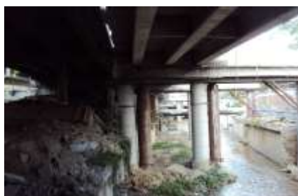
Figura No 20. Malas terminaciones en los elementos estructurales de la ampliación ejecutada a la altura de la avenida La Facultad – Los Chaguaramos