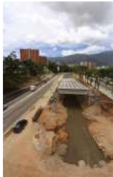
Figura No 15. Destrozos al embaulamiento por obras de ampliación en el río El Valle vistas desde la Bandera cruce con Paseo Los Ilustres.

El río El Valle se ha convertido parcialmente, en el trayecto de la ampliación ejecutada, en un sistema de drenaje semicubierto (figuras 15 y 16), contrarrestando las condiciones de humedad ambiental, generando un aumento de la sensación de calor que impera en la zona.