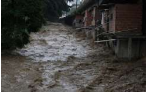
Figura No 12. Creciente de aguas en el río El Valle vistas desde la Av. Bellas Artes cruce con Av. La Facultad.

Es allí donde se perciben los más altos niveles de deterioro como consecuencia de la disposición en su cauce de 27 columnas de concreto armado, de 1,30 m de diámetro, separadas a 15 48 m una de la otra y recubiertas de acero. Definitivamente se está en presencia de un mal criterio estructural en virtud de que este tramo del río es adyacente a las viviendas precarias del barrio Los Chaguaramos y donde las lluvias han generado mayores crecientes (figura 12) y desbordamientos.