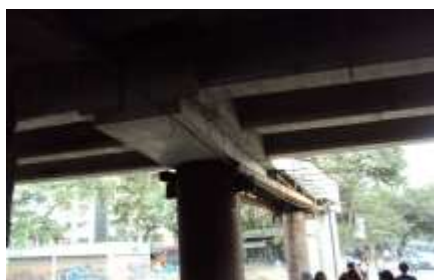
Figura No 19. Malas terminaciones en la parte inferior de la ampliación ejecutada a la altura del Puente Bellas Artes al frente del barrio Los Chaguaramos.

En la ampliación realizada prevalecen las malas terminaciones. Pésimos acabados denotan la aplicación de concreto a la vista 51 sin los cuidados y precauciones necesarias (figuras 19 y 20). Seguramente se requerirán grandes inversiones para dar un acabado admisible a esta obra.