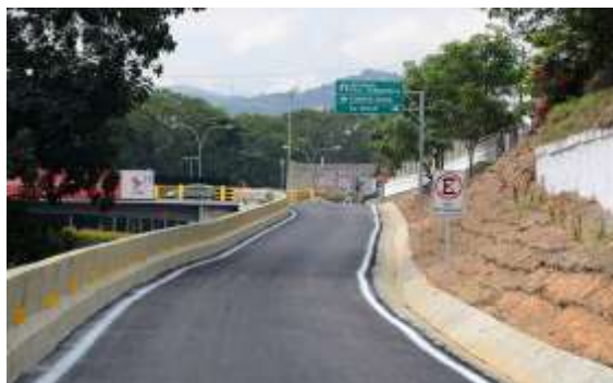
Figura No 3. Rampa de acceso (“trocha de Longaray”) al puente que comunica hacia la alcabala No 3 de Fuerte Tiuna.

Hasta ese entonces la autopista Valle-Coche disponía únicamente de dos puntos de salida (La Bandera y el distribuidor La Gaviota) por lo que esta solución resultó práctica en cuanto al retorno en si hacia Plaza Venezuela y como punto de salida hacia las calles de la parroquia El Valle.