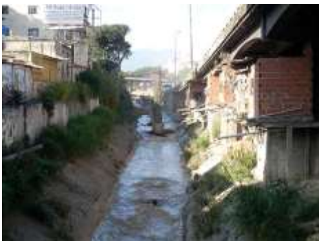
Figura No 13. Daños ocasionados al embaulamiento por columnas en el río El Valle vistas desde la Av. Bellas Artes cruce con Av. La Facultad.

En fecha 15/agosto/2005 49 surgió la idea de sanear el río Guaire. El compromiso pautado fijaba como meta que tal cometido se lograría para el siguiente año lo cual se notaba apresurado. No obstante, se iniciaron las inversiones 50 y se organizaron grupos de trabajo. Las obras de ampliación de la autopista Valle-Coche no responden a principios de sustentabilidad ni conservacionismo ambiental. Los daños ocasionados darán al traste con la intención de recuperar este cuerpo de agua y por ende el Guaire tampoco podrá ser saneado.