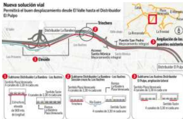
Figura No 9. Cartel publicitario con la descripción de la obras de ampliación de la Valle-Coche.

Para el 21 de diciembre de 2015, día de la inauguración de la ampliación, este ministerio había pasado por tres titulares: el Ing. El Troudi fue seleccionado candidato a diputado a la Asamblea Nacional y entregó la cartera de dicho Ministerio el 4/sept/2015, estando aún en ejecución los trabajos de ampliación de la Valle-Coche. Lo sustituyó en el cargo José L. Bernardo hasta el 16 de diciembre de 2016 cuando asumió el Ing. Luis Sauce.