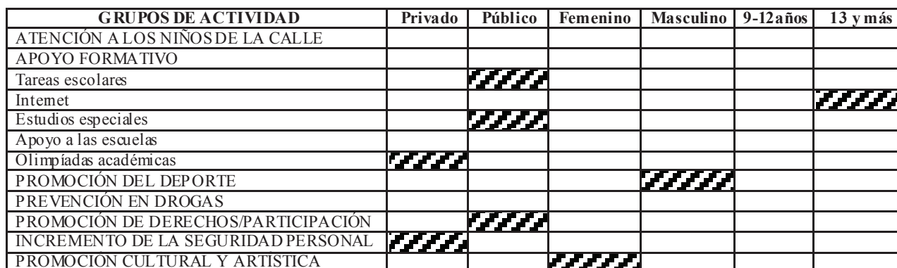
CUADRO 21. INTENSIDAD DE LA DEMANDA DE CIERTAS ACTIVIDADES, POR PARTE DE GRUPOS ESPECÍFICOS

Nota: los espacios subrayados son los que evidencian una mayor asociación entre una escogencia y cierto grupo.