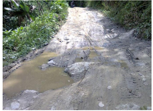
Vialidad de El Hondón