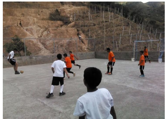
Encuentros Deportivos, Espacio Educativo Valle de San Isidro