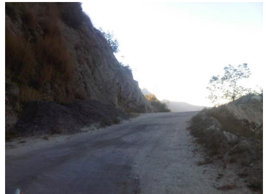
Vialidad de La Planada