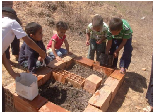
Manos a las Siembras, Espacio Educativo Maya