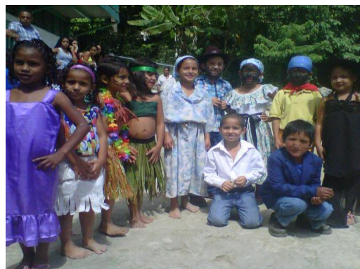
Actividad Cultural, Espacio Educativo Gamelotal