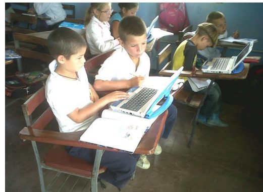
Espacio Educativo La Planada