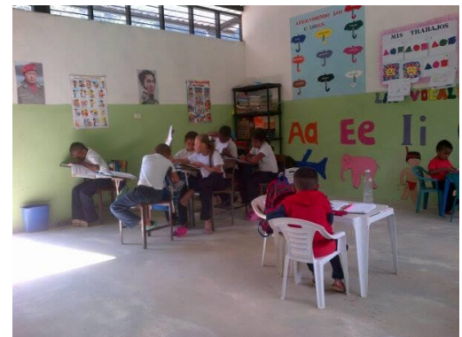
Espacio Educativo Río Laguneta