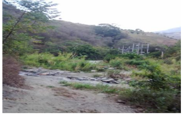
Vialidad de Las Mercedes