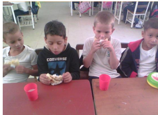
Programa Alimentario Escolar, Espacio Educativo Las Mercedes