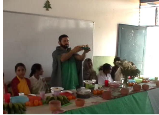
Actividad Cultural, Espacio Educativo Valle de San Isidro