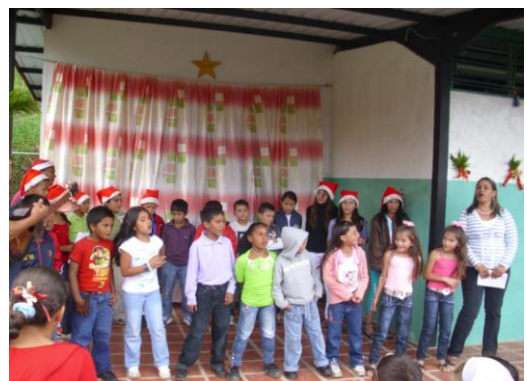
Espacio Educativo La Lagunita