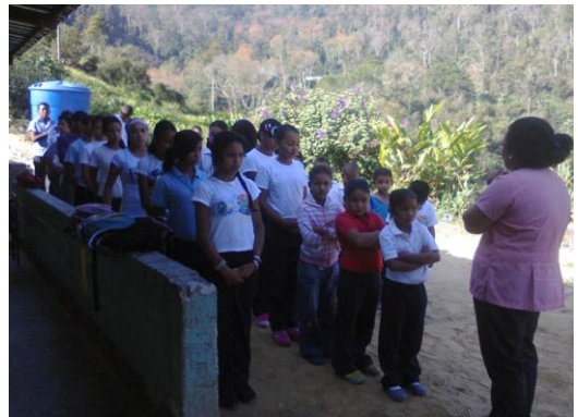
Espacio Educativo El Hondón