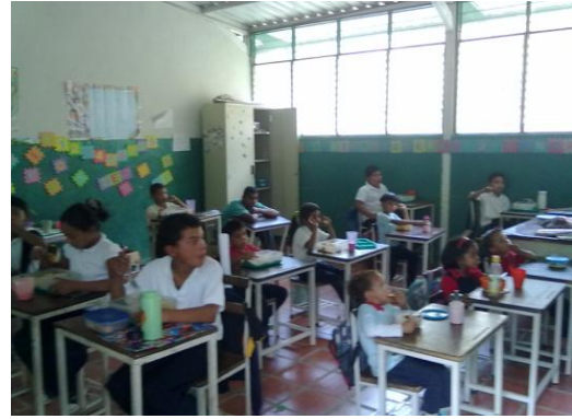
Programa Alimentario Escolar, Espacio Educativo Pedregal