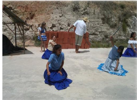
Actividad Cultural, Espacio Educativo Capachal