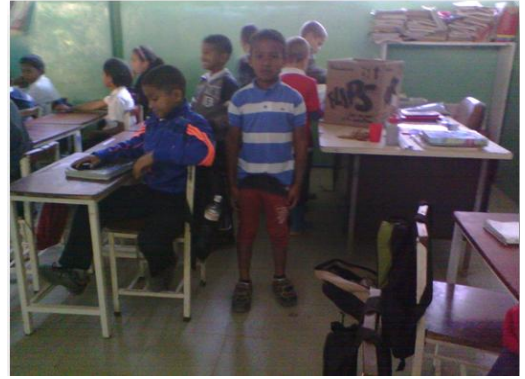
Espacio Educativo Las Mercedes