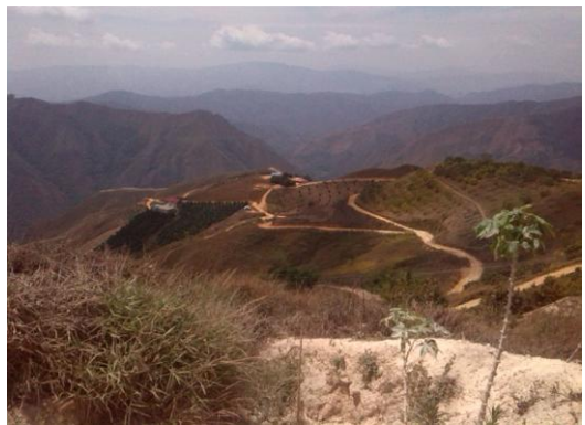
Vialidad de La Ciénaga