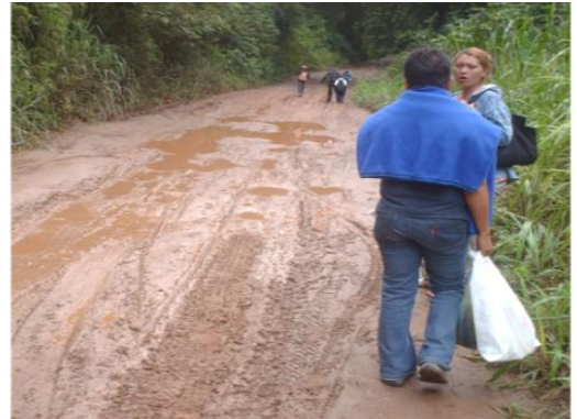
Vialidad de El Lindero