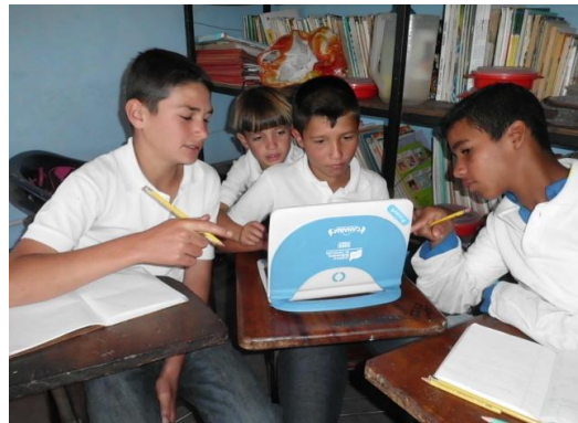
Canaima, Espacio Educativo La Planada