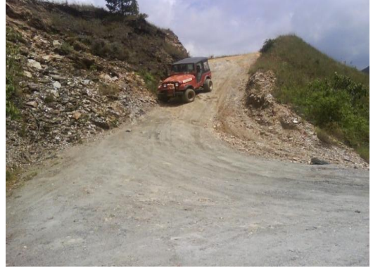
Vialidad Valle de San Isidro