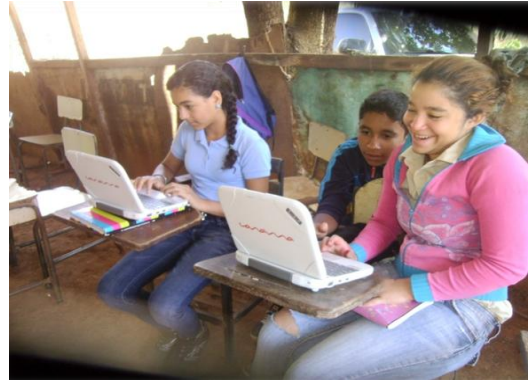
Canaima, Espacio Educativo El Lindero