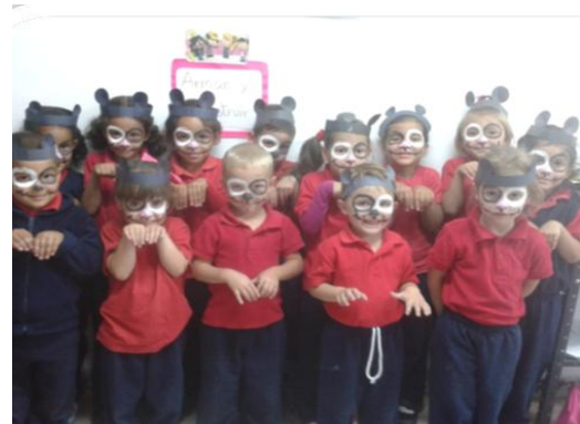
Actividad Cultural, Espacio Educativo La Lagunita