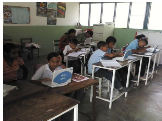
Canaima, Espacio Educativo Valle de San Isidro