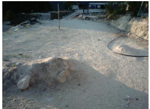
Vialidad de San Luis