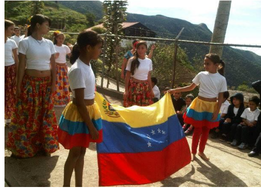
Actividad Cultural, Espacio Educativo Cumbote