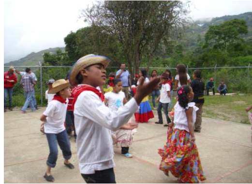
Actividad Cultural, Espacio Educativo La Lagunita