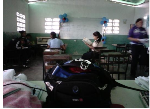
Espacio Educativo San Luis