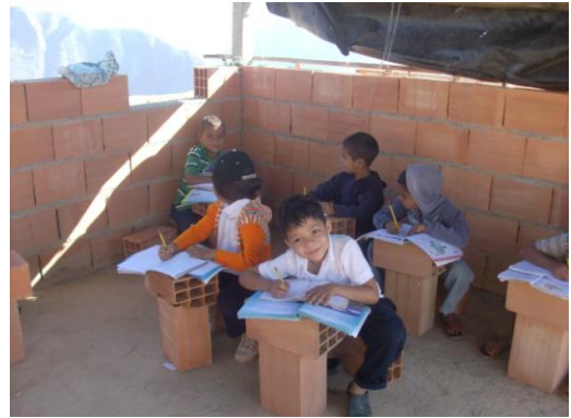
Espacio Educativo Maya de Las Peonías