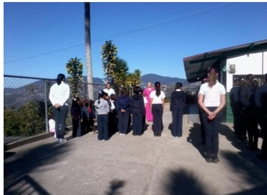
Espacio Educativo Cumbote