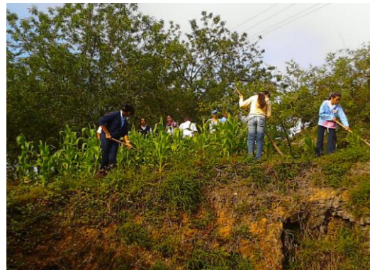
Manos a las Siembras, Espacio Educativo Capachal