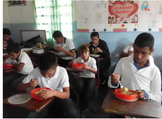
Programa Alimentario Escolar, Espacio Educativo La Planada