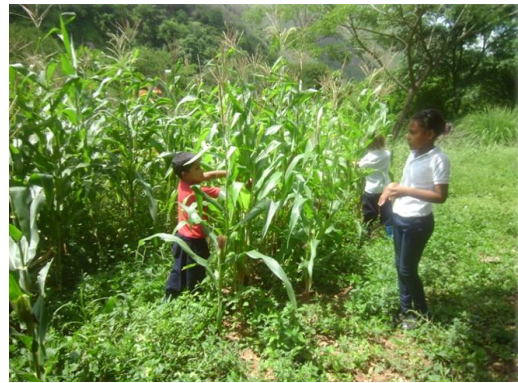
Manos a las Siembras, Espacio Educativo El Lindero