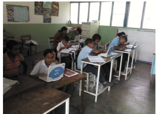
Espacio Educativo Valle de San Isidro