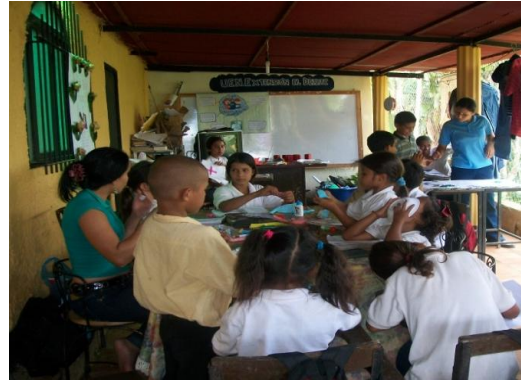
Espacio Educativo El Deleite