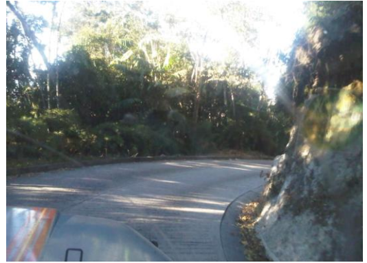
Vialidad del Paují