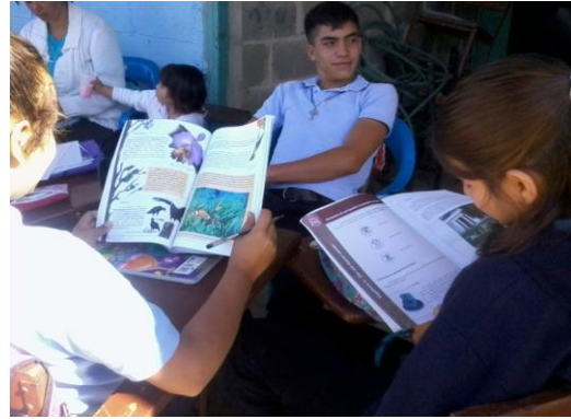
Plan LEER, Espacio Educativo Cumbote