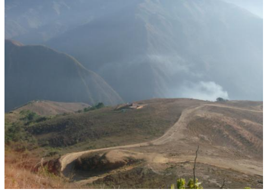
Vialidad de Maya