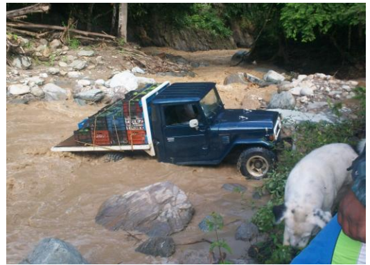
Vialidad de Pedregal