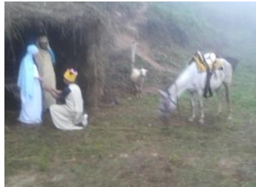
Actividad Cultural, Espacio Educativo Valle de San Isidro