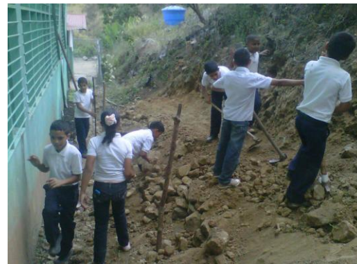
Manos a las Siembras, Espacio Educativo El Deleite