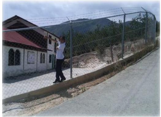
Vialidad de Capachal