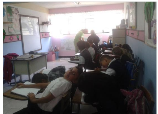
Espacio Educativo El Paují