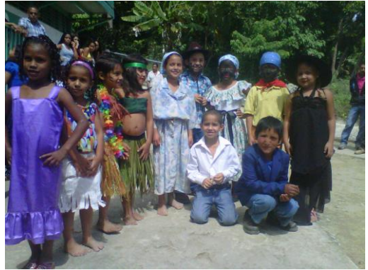
Espacio Educativo Gamelotal