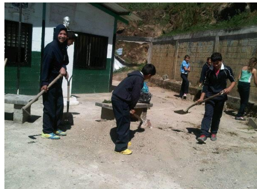
Manos a las Siembras, Espacio Educativo Cumbote