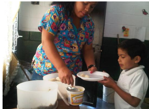
Programa Alimentario Escolar, Espacio Educativo Cumbote