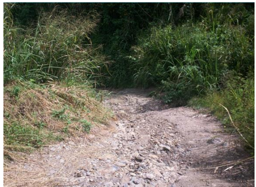
Vialidad de Río Laguneta