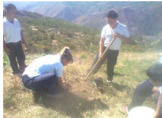
Manos A Las Siembras, Espacio Educativo La Planada