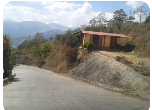
Vialidad de Gamelotal