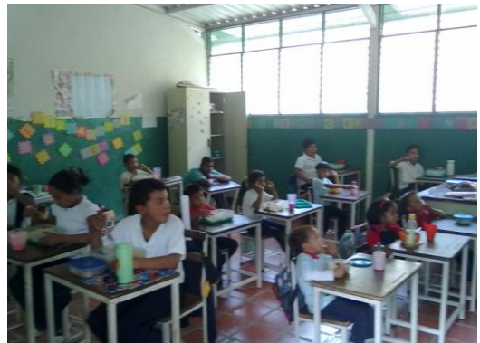
Espacio Educativo Pedregal