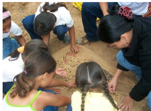
Plan LEER, Espacio Educativo El Deleite