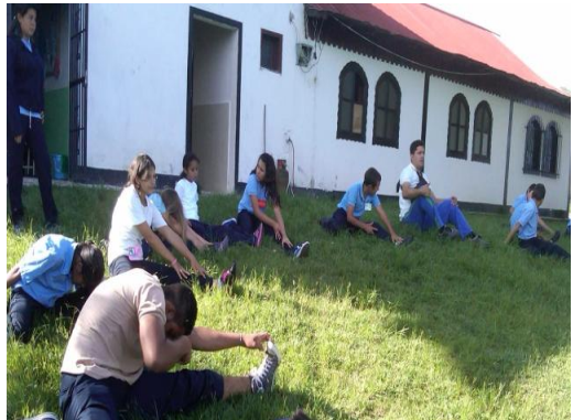
Espacio Educativo Capachal