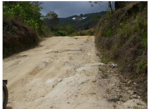
Vialidad de La Lagunita