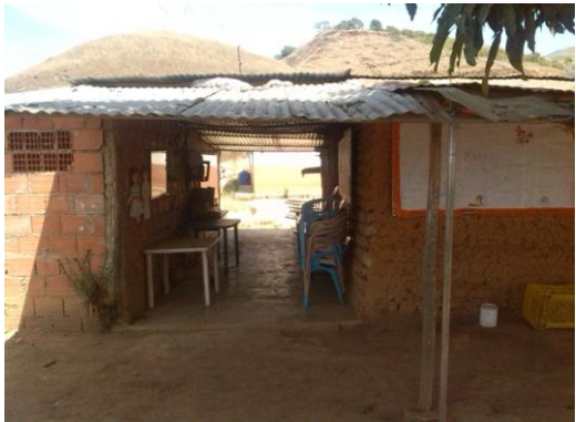
Espacio Educativo La Ciénaga