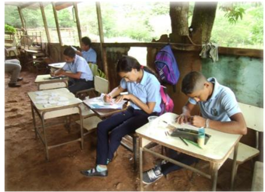
Espacio Educativo El Lindero