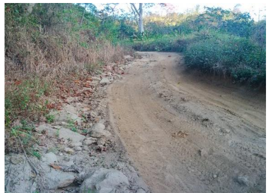
Vialidad del Deleite