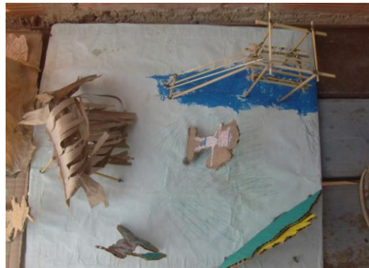
Actividades de Manualidades, Espacio Educativo Maya